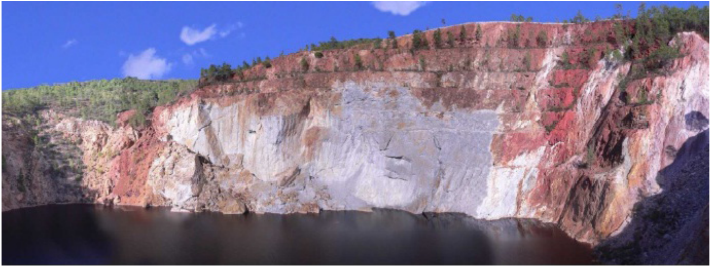
Vista Norte de la Corta Peña de Hierro

tal fin se rehabilitó el canal de desagüe que parte del túnel Sta. María y se encauzó el canal de desagüe proveniente de la Corta, situado bajo la trituradora. También se construyó anexo a los depósitos de mineral la zona de aparcamiento.