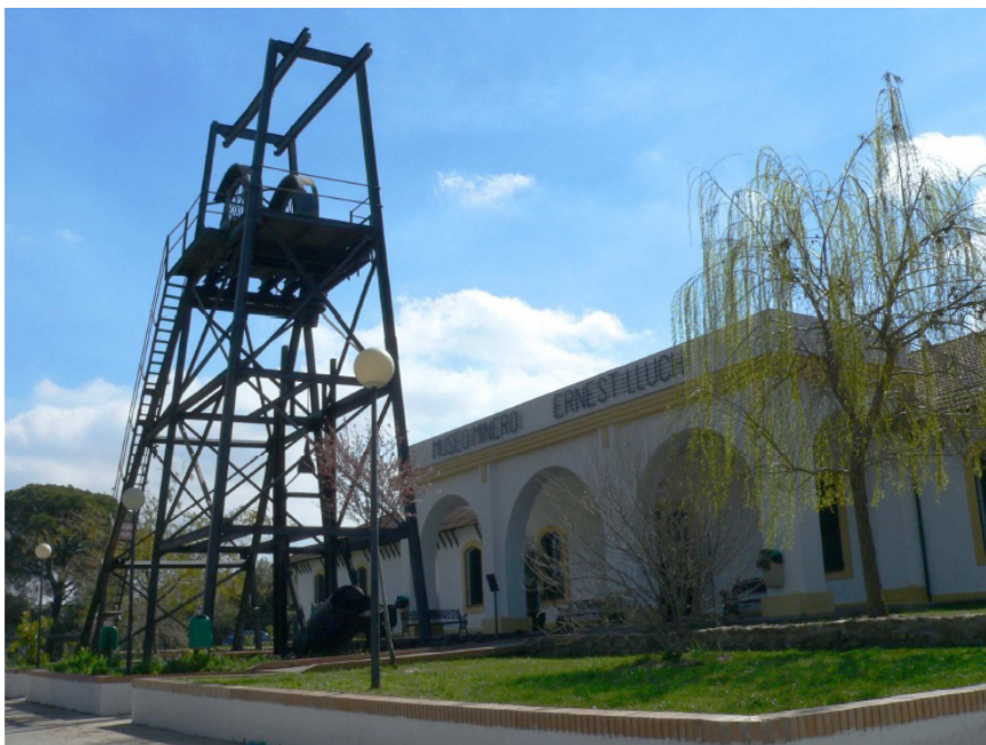
Museo Minero de Ríotinto

con la compañía británica que no podían costearse su propia sanidad las llamadas “camas de gracia”. Fue proyectado por el arquitecto británico R. H. Morgan en 1925 e inaugurado en 1927. Consiste en un edificio de cuatro cuerpos paralelos unidos por una pasillo central que los cruza por su parte central con cubierta a dos y cuatros aguas mediante teja plana de tipo inglés.