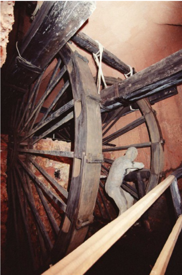
Noria, Reproducción de Mina Romana museo Minero. Foto Aragón