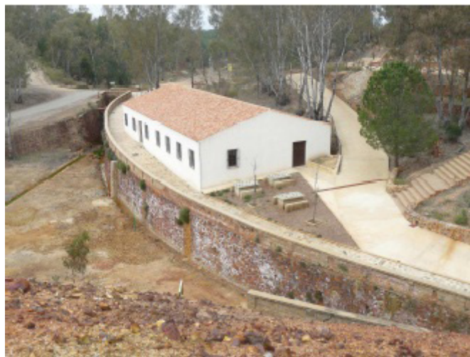
Centro de Recepción de Visitantes, 2009, Foto ADD.

Todos los trabajos descritos permitieron la puesta en servicio turístico la Mina de Peña de Hierro desde el 24 noviembre de 2004.