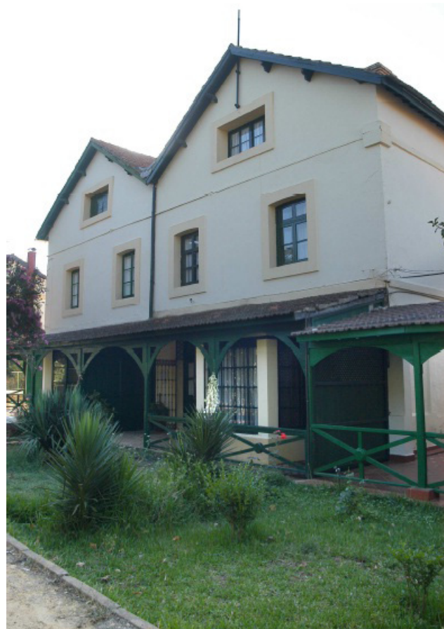
Fachada Casa nº 21, Foto Aragón.

Esta vivienda de estilo victoriano posee una superficie de 540 m 2 dispuesta en tres plantas y dos jardines. Fundación Río Tinto la adquirió en 1996 y desde entonces ha venido trabajando en ella. La labor realizada se ha desarrollado en tres fases. Primero se procedió a la recuperación de la arquitectura victoriana original, siguiendo los planos conservados en la Cartoteca del Archivo Histórico de Fundación Río Tinto. Todos los trabajos de esta fueron realizados mediante programas formativos de Escuelas Taller y Talleres de Empleo. Segundo se dotó la Casa 21 con mobiliario de época. En este punto se hace necesario reseñar que un 20 % de lo expuesto es fruto de donaciones realizadas desinteresadamente. Tercero y último se llevó a cabo el montaje museográfico de la misma, realizado por el Departamento de Conservación de Fundación Río Tinto.