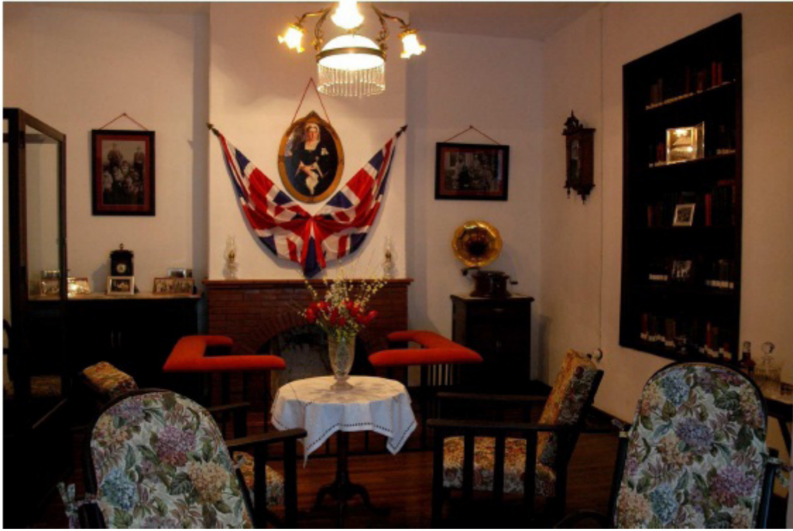
Salón, Casa nº 21, Foto Aragón.

cado en el antiguo cuarto de juegos está dedicado a mostrar con fotografías históricas y cartelera como se desarrolló la vida cotidiana de la colonia británica durante casi un siglo. Por último se ha instalado un sistema de audio que permite la visita libre. Así acercarse a conocer esta sección del Museo Minero es realizar un viaje en el tiempo a la época victoriana.