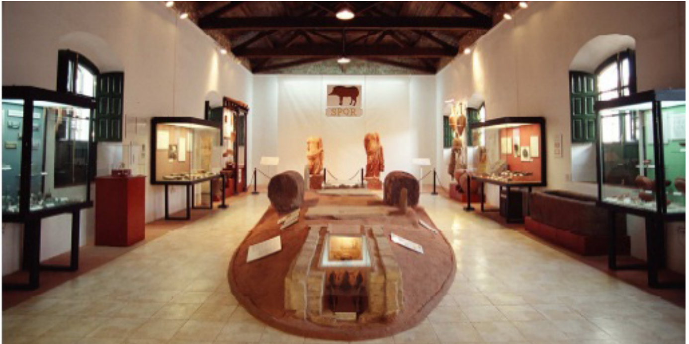
Sala nº 5, Época Romana, Museo Minero, Foto Aragón.