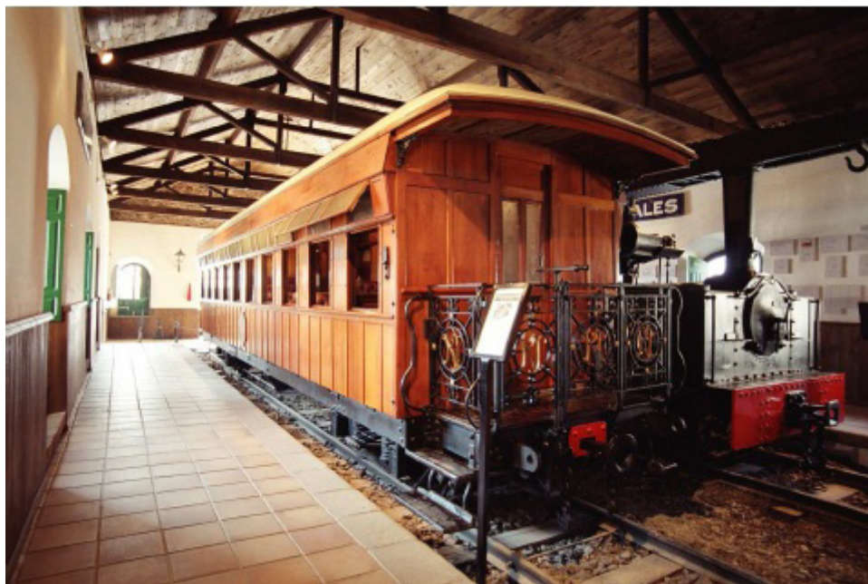
Vagón del Maharajah, Sala nº 4 y Sala nº 12, Museo Minero.

La Casa nº 21 del Barrio de Bella Vista (Minas de Riotinto, Huelva) es la Sección Etnográfica del Museo Minero. Está gestionada por Fundación Río Tinto, fue inaugurada el 28 de julio de 2005. Está integrada junto con el Museo Minero en la Red de Museos de la Comunidad Andaluza. Esta vivienda fue construida en 1883 por RTCL para albergar a los miembros del Staff y sus