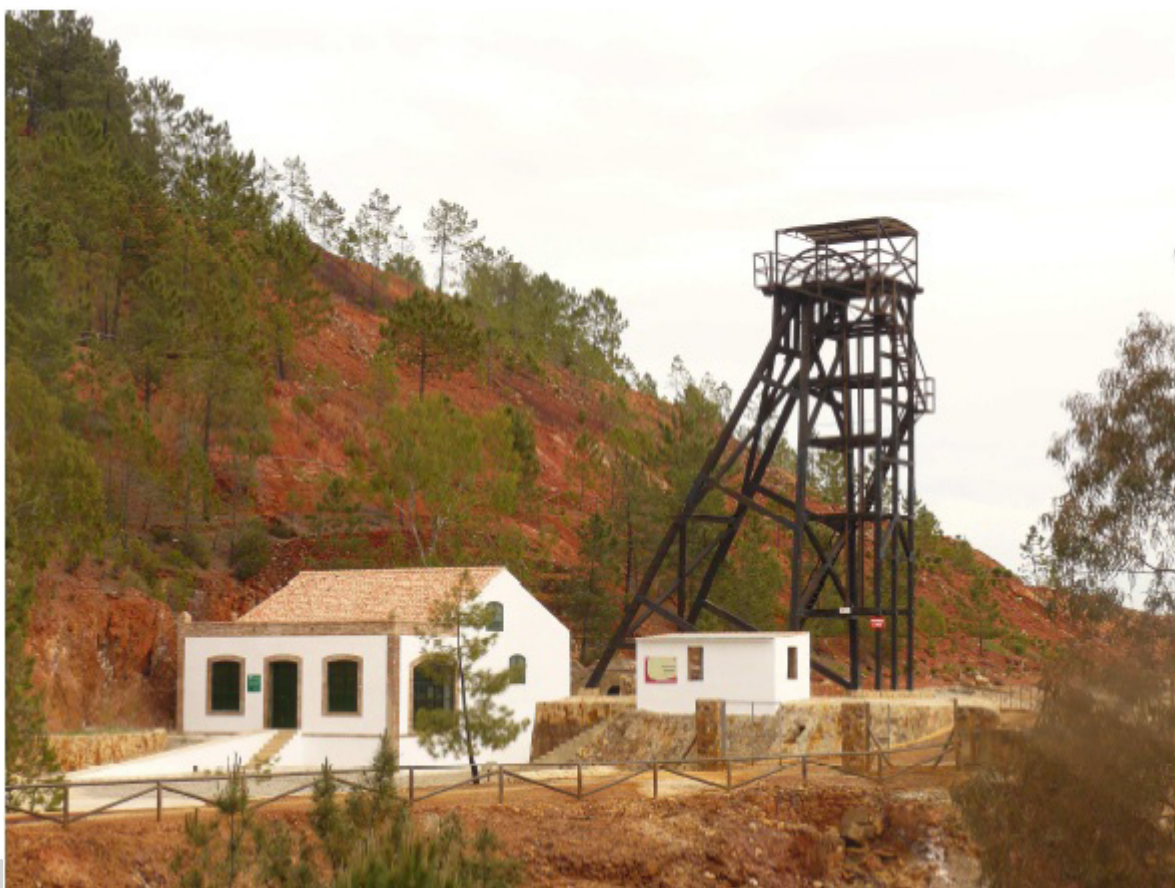
Casa de máquinas y Malacate de Peña de Hierro, 2009