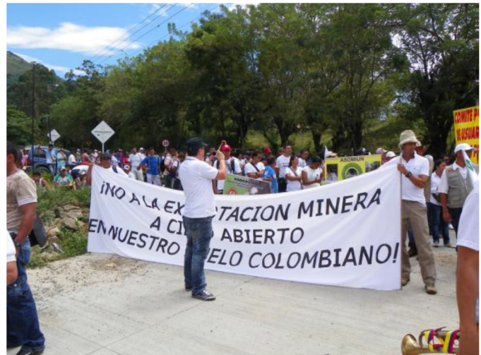
Fotografía 3. Marcha Nacional Por la defensa de la Vida, el Trabajo y el Territorio (Marmato, 2012)

La resistencia social cobró gran importancia en el municipio de Marmato a partir del año 2004 cuando la comunidad realizó el Manifiesto Marmateño en defensa del territorio y en contra del megaproyecto minero. Dos años después, nacería uno de los movimientos sociales locales más representativos en el contexto nacional. Se trata del Comité Cívico Prodefensa de Marmato , conformado por los pobladores locales (indígenas, afrodescendientes y mestizos) y mineros tradicionales, quienes se habían organizado en torno al citado manifiesto. Posteriormente, en el año 2011 los mineros locales conformaron la Asociación de Mineros Tradicionales de Marmato , organización que actualmente se encuentra integrada por más de 600 mineros.