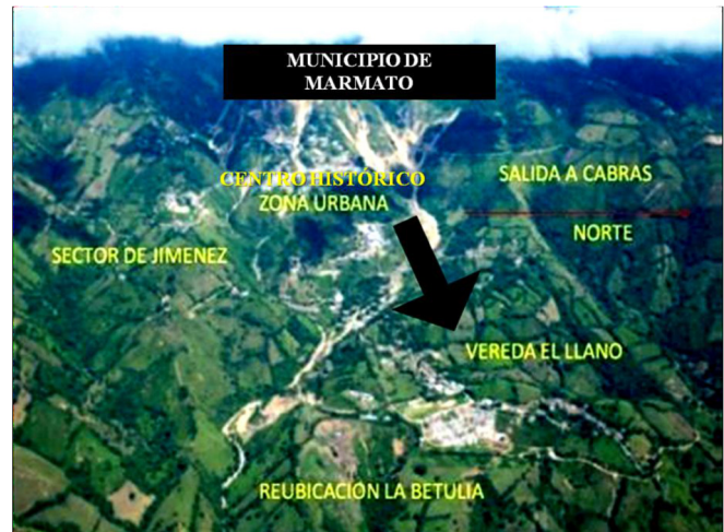
Fotografía 2. Proyecto de “traslado” del centro histórico de Marmato a la vereda El Llano para consolidar el megaproyecto de minería a cielo abierto.

Para el megaproyecto minero las transnacionales citadas han requerido el traslado del centro histórico de Marmato, ubicado en la parte alta del cerro minero, a la vereda El Llano, en la parte baja (Ver fotografía 2), rompiendo con las tradiciones históricas y culturales de los marmateños, despojando del único sustento a miles de familias que viven de la minería tradicional, promoviendo la concentración del territorio en una sola compañía transnacional y atentando con la construcción histórica y cultural del territorio asociada con la distribución del cerro minero de Marmato (Ver fotografía 1)