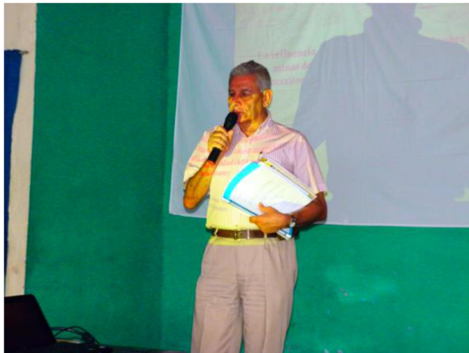
Fotografía 4. Seminario "Legalidad Histórica de Marmato y Propuesta para el Nuevo Código Minero" (Marmato, 2012)

dinámicas de resistencia social en el contexto internacional y nacional, en el municipio de Marmato se han realizado acciones de resistencia civil como marchas, paros cívicos, bloqueos de vías, talleres, foros, ciclos de conferencias, seminarios, reuniones de fortalecimiento comunitario e intercambio de experiencias para proponer salidas a sus problemas.