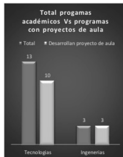
Figura 3. Total programas académicos versus programas con proyectos de aula