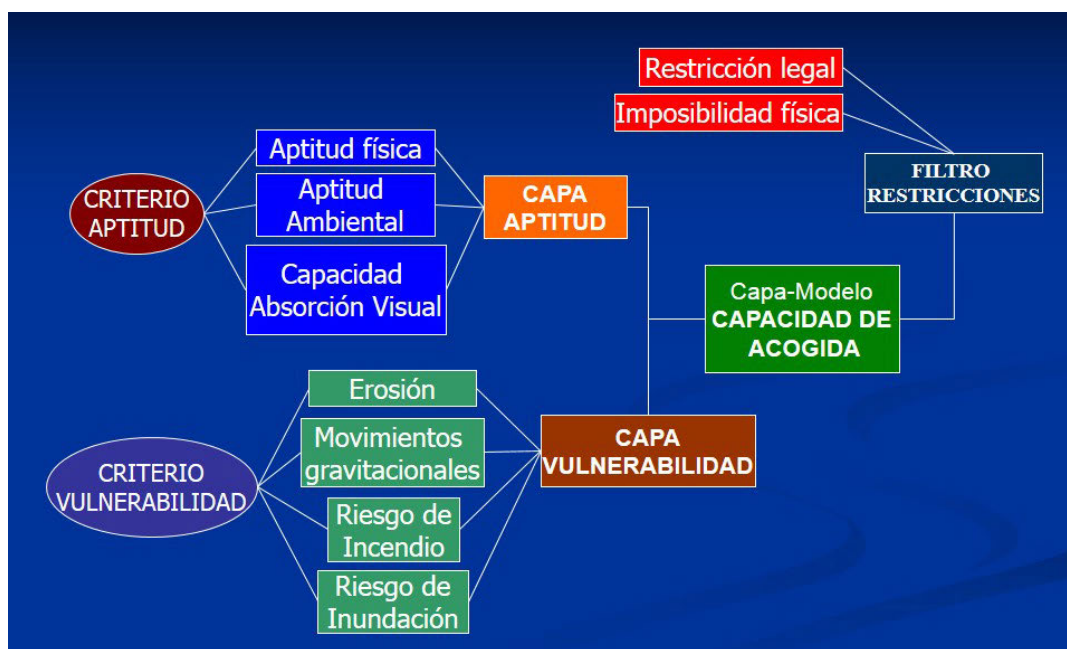
Figura 1. Esquema del proceso de evaluación.

Como se ha visto hasta aquí, para componer la estructura de los dos criterios principales de aptitud y vulnerabilidad se han desgranado otros criterios en un proceso de especialización. Estos criterios se configuran en base a una o varias variables territoriales o en base a uno o varios factores. De esta manera, cada alternativa proviene de una variable territorial y con ello cualquier área donde se localice dicha alternativa es en sí misma una posible alternativa. Es cuestión importante enumerar adecuadamente las variables territoriales y los factores que darán lugar a dichos criterios. Ante el considerable número de variables que pudieran surgir, se utilizarán sólo aquellas que se consideran significativas, positiva o negativamente, intentando evitar las redundancias consecuentes de las relaciones existentes entre los elementos y características ambientales. En la figura 1 se muestra la lógica del proceso de evaluación.