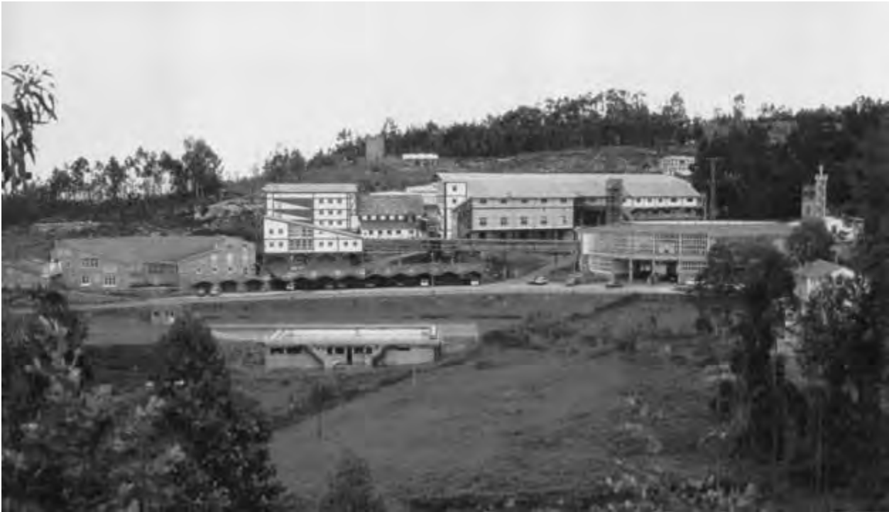
A fábrica de Sargadelos