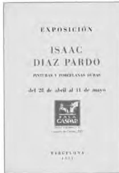
Catálogos de exposicións realizadas por Díaz Pardo en Vigo en 1947 e en Barcelona en 1951