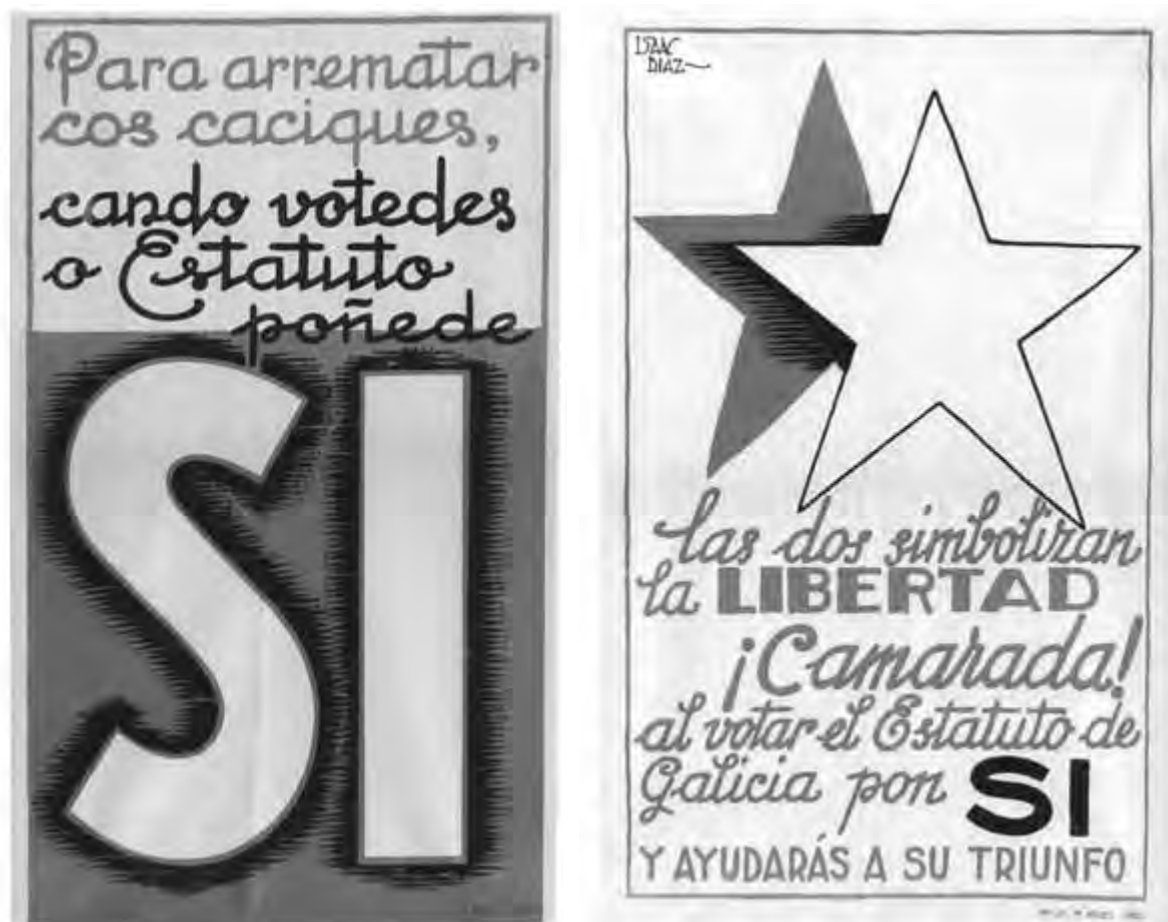
Carteis en favor do Estatuto de Autonomía de 1936 realizados por Isaac Díaz Pardo