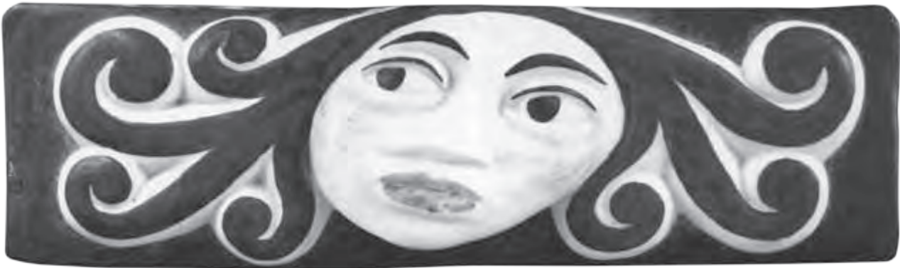
Porcelana do Castro dos anos 50

os debuxos, as pinturas e o diñeiro preciso e puxérono todo nas mans do director de Ruedo Ibérico, que lles devolveu ao país suramericano as pranchas xa listas para imprimir na Imprenta López, que era coa que Seoane traballaba en Bos Aires 5 . Rematada a edición, enviaron os libros a París para iniciar a distribución internacional.