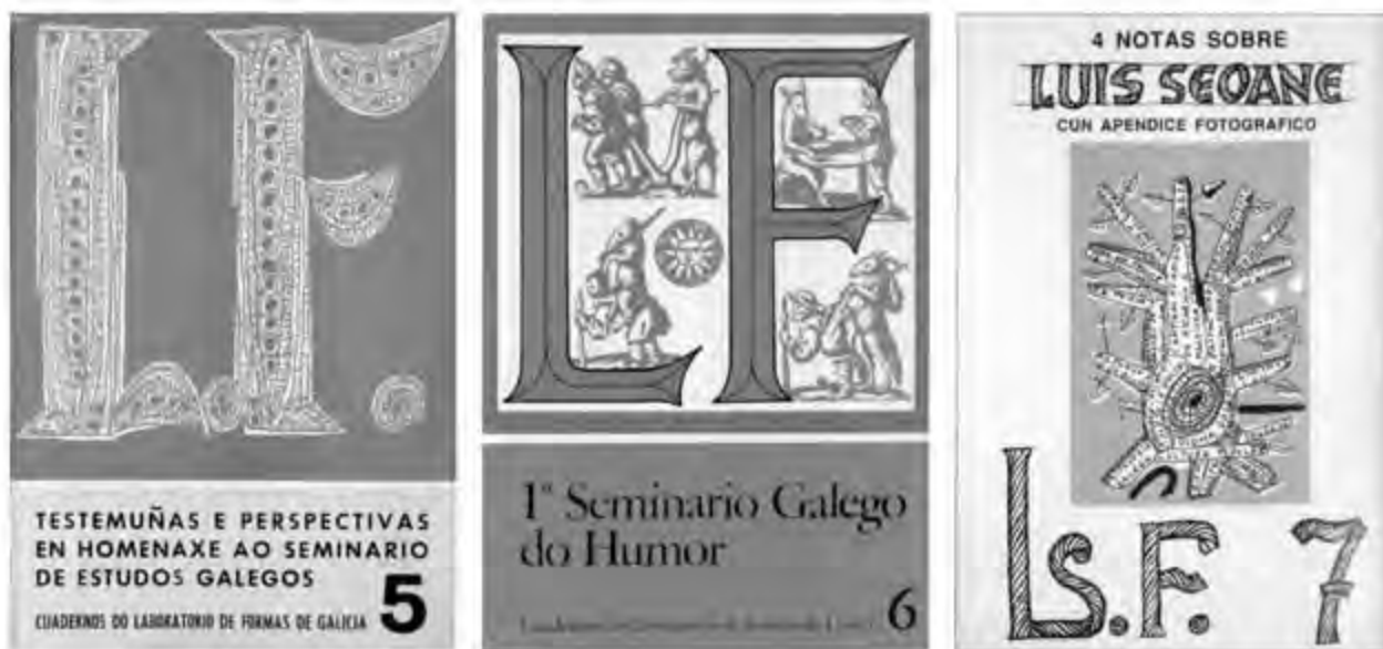
Laboratorio de Formas, portadas dos últimos cadernos

súa pintura e a produción cerámica do Castro no Centro Galego de Bos Aires e acepta a invitación de montar a Fábrica de Porcelanas Magdalena , na marxe dereita do Río da Prata, a 108 quilómetros de Bos Aires, semellante á que fixera no Castro, aínda que máis evolucionada, baixo os auspicios dunha sociedade denominada Celtia S.A., da que formaban parte Cerámicas do Castro e moitos dos exiliados.