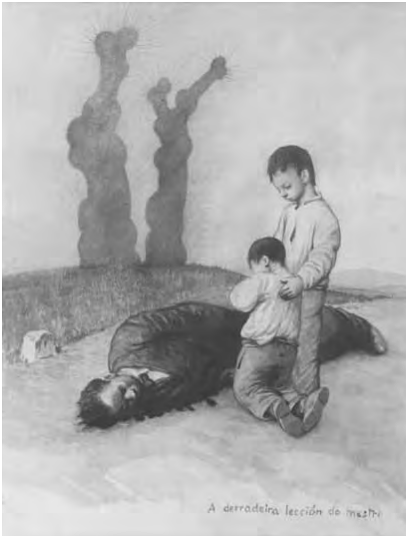
«A derradeira lección do mestre», debuxo de Castelao