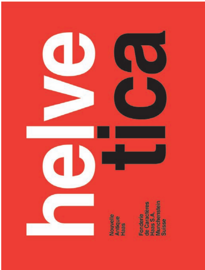
_Imagen 3. Helvética

depreciación de las condiciones posmodernas. Regresar al estado 0 del diseño, a sus opciones más restrictivas y simplificadoras después de la experimentación posmoderna fue propuesto ya desde el número 19 de la revista Emigre (1991) titulado "Starting from zero". 6 Esta discusión fue retomada 11 años más tarde en la misma revista en el número 64, alzando voces críticas contra la generación posmoderna sumida en los mismos argumentos de la era pasada y que se habían convertido ya en la vieja guardia. En este sentido, el texto Complex Simplicity 7 de Andrew Blauvelt (2001) señala la domesticación e instauración oficial de la revolución posmoderna, lo cual supone el inicio de su decadencia.