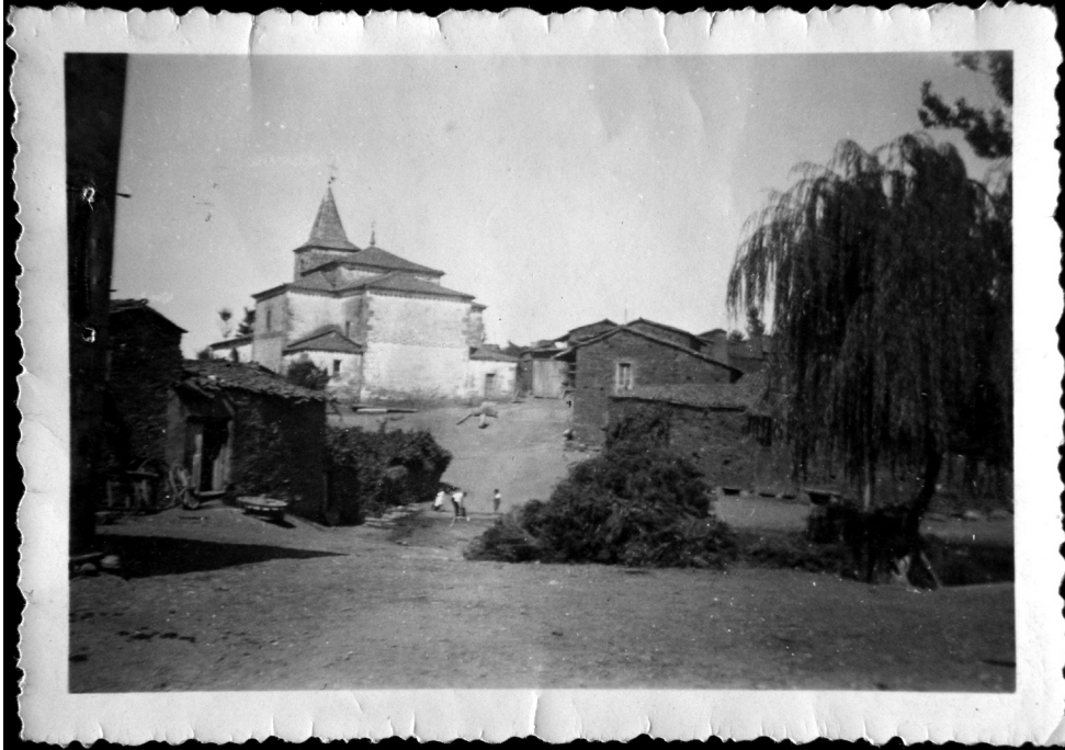
Imagen 2. Iglesia de Sejas de Aliste antes del incendio de la torre.