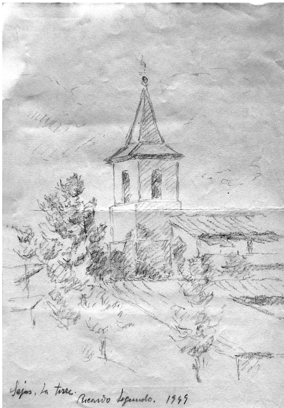
Imagen 3. Dibujo.