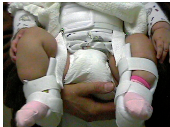
Figura 5. Arnés de Pavlik

El arnés de Pavlik se conoció en 1944 y ha sido utilizado desde entonces. Es un dispositivo de posicionamiento dinámico que permite que el niño se mueva libremente dentro de los rangos de este aparato 14,15,17 . Consiste en una serie de correas: una circunferencial al pecho con correas para los hombros y tiene sitios de amarre para los miembros inferiores; las correas anteriores de los miembros inferiores son para controlar la flexión de las caderas; las posteriores previenen la aducción de las caderas (ver Figura 5). Las indicaciones de su uso incluyen la presencia de una cadera reducible en un niño que no hace intentos de ponerse de pie. Si la cabeza no se reduce en dos semanas después de uso adecuado, se recomienda cambiar el método. Después de reducida la cadera, como regla general, se deja el aparato un tiempo determinado por la edad del niño al momento de obtener la reducción más tres meses 14,15,17 .