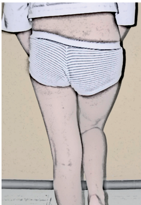
Figura 1. Se observa el clásico signo de Trendelenburg, donde se cae la cadera derecha por insuficiencia del músculo glúteo medio.

La displasia acetabular solo se puede determinar por medio de imágenes; la clínica puede estar ausente en un niño con displasia acetabular sin subluxación o luxación 2,7 . La ultrasonografía se ha establecido como un método imagenológico no invasivo de la cadera durante los primeros meses de vida; con ella se puede visualizar el cartílago y se puede asesorar la estabilidad de la articulación. La ultrasonografía dinámica desarrollada por Harcke, evalúa la cadera y la estabilidad de la cabeza femoral en el acetábulo, además brinda información de la anatomía estática brindando una mejor información en esta patología. Se debe recalcar que los resultados acertados en la ecografía de cadera requieren de entrenamiento y experiencia del operador 2,7,8 .