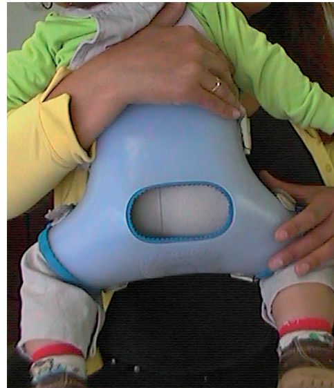
Figura 4. Férula de Milgram

La cadera que es luxable al nacimiento puede corregirse espontáneamente y debe ser observada por tres semanas sin tratamiento. El uso del doble o triple pañal para prevenir la aducción de caderas, no ha demostrado buenos resultados comparados con no hacer nada en las tres primeras semanas de vida 11,12 . Si se observa luxación desde el nacimiento, es obligatorio intervenir al paciente inmediatamente 13-7 . Se han empleado múltiples dispositivos para el tratamiento de la inestabilidad de cadera en infantes, incluyendo una espica de yeso, la almohada de Fredka, la férula de Craig, la férula de Milgram y la férula de Von Rosen (ver Figura 4) 14 .