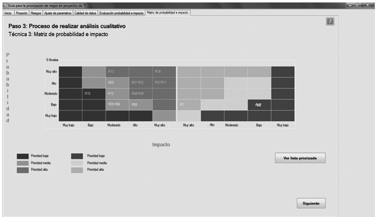
FIGURA 6. Matriz de probabilidad e impacto.