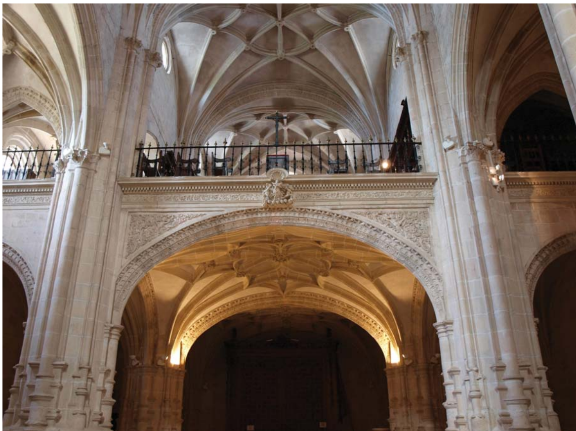
Fig. 5. Interior de la iglesia del monasterio de La Vid (Burgos).

ción de las roscas de los arcos, cornisa y entablamentos, pero sobre todo en la resolución barroca del programa iconográfico introducido en la decoración (fig. 5).