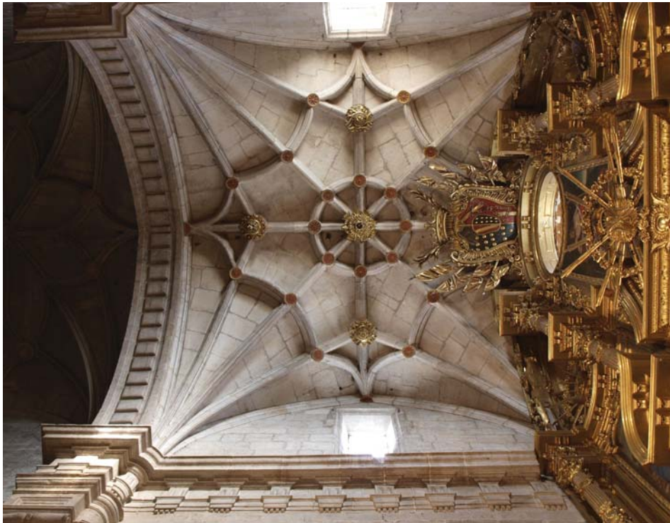
Fig. 4. Bóveda de la capilla mayor. Colegiata de Nuestra Señora del Manzano. Castrojeriz (Burgos).

ción de la cabecera y optar por las formas góticas en el interior, entre otras posibles soluciones más fáciles.