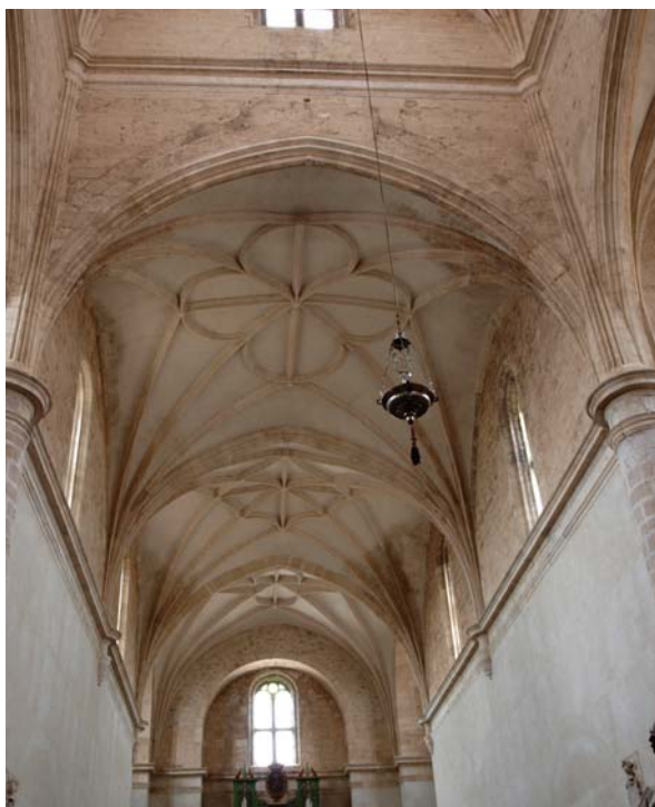
Fig. 2. Interior de la Colegiata. Peñaranda de Duero (Burgos).

inscripción que ostenta la fachada, de clara factura barroca en contradicción flagrante con el interior 45 .