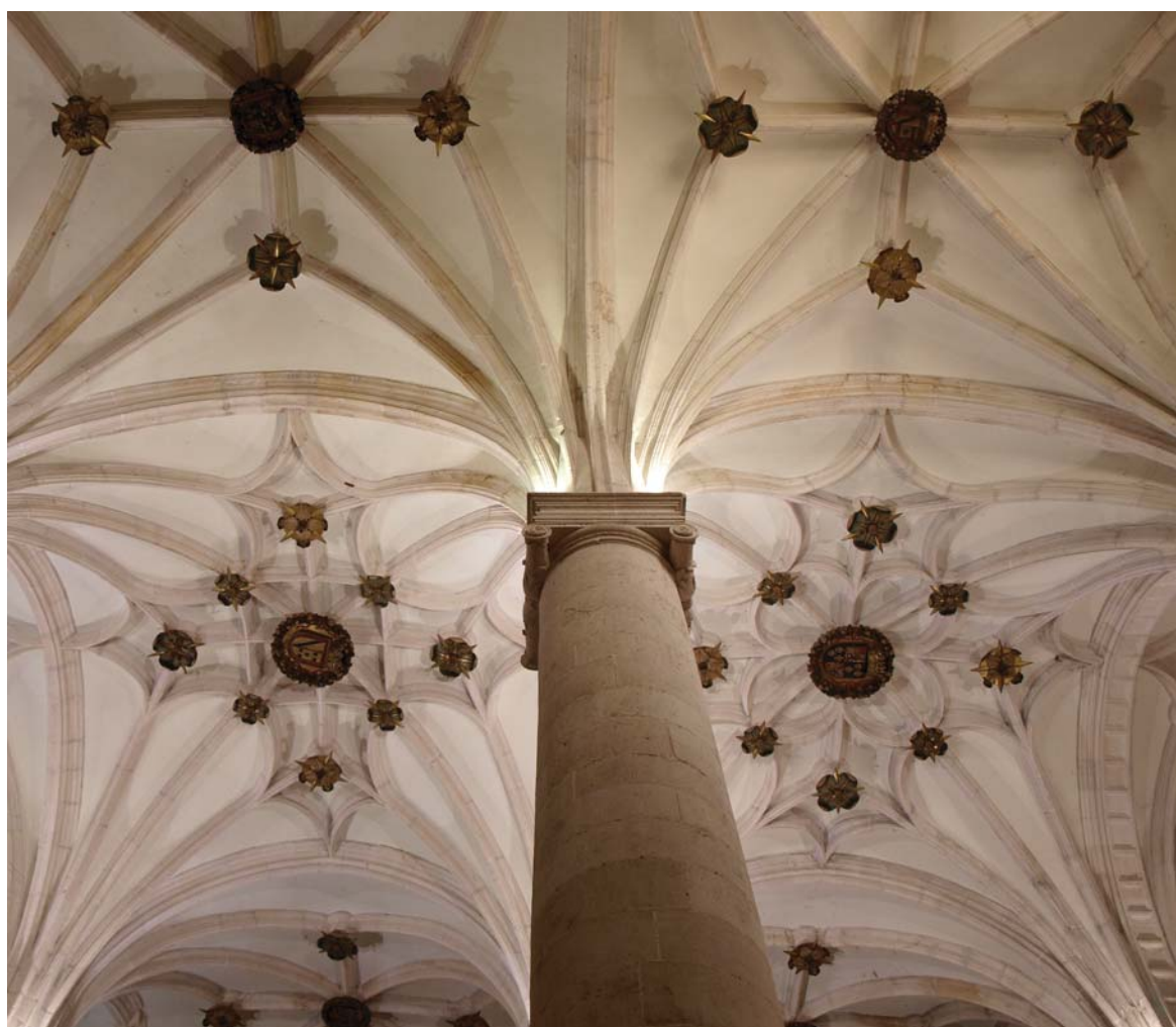
Fig. 1. Bóvedas de la Colegiata de San Pedro de Lerma (Burgos).

contribuye la utilización para su formación de arcos apuntados poco agudos en unos casos y en otros de medio punto (fig. 1). Esta variedad habría que achacarla a las diferentes etapas constructivas y a la adaptación que debió hacer fray Alberto, lo cual no impide que el conjunto muestre una notable apariencia de unidad. Es plausible pensar que el uso de la crucería se hiciera con una intencionalidad ideológica: resaltar el carácter antiguo de la Colegial y ganar así abolengo 26 . La contradicción más llamativa aparece en la sucesión establecida en los soportes, que arrancan con gruesas columnas de fuste liso, rematadas con capiteles jónicos, que reciben los haces de las nervaduras de las bóvedas estrelladas, rompiendo así todos los esquemas de la normativa propia de los órdenes clásicos.