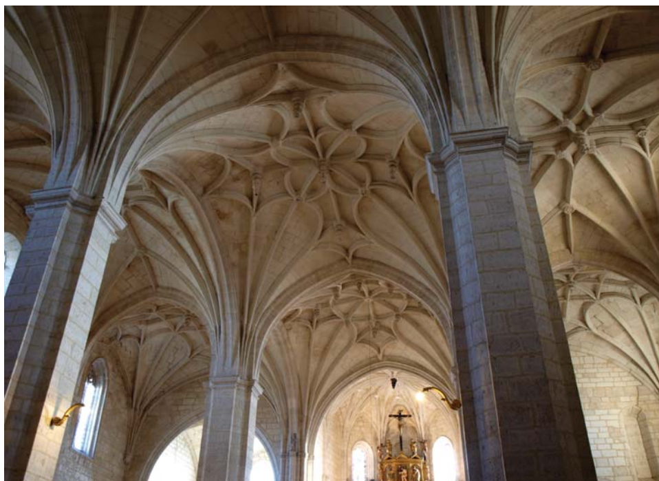
Fig. 3. Cubiertas de la iglesia de San Nicolás. Santibáñez-Zarzaguda (Burgos).