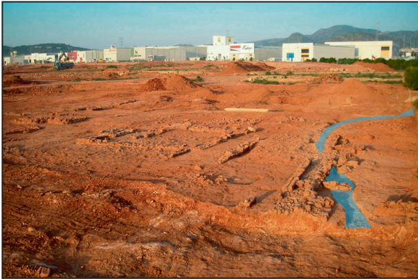
1. Vista general de La Mezquita