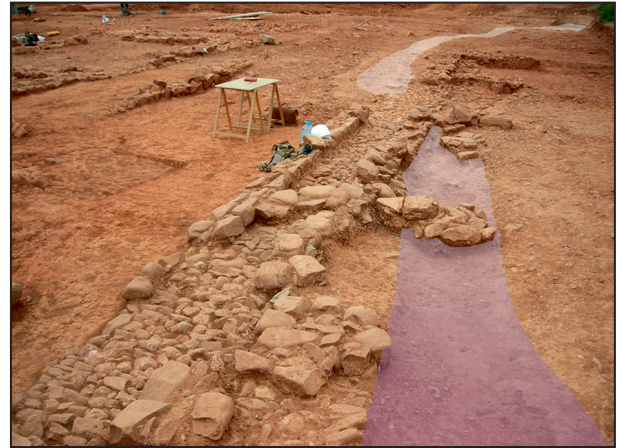
2. Vista del canal y cauce.