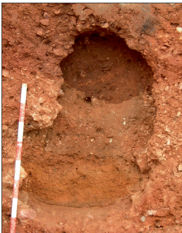
7. Vista tramo soterrado.