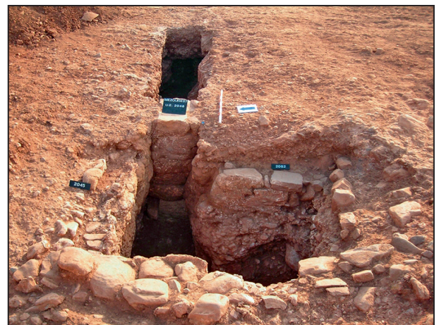
4. Vista cárcavo y sifón.