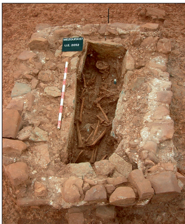
8. Sepultura múltiple.