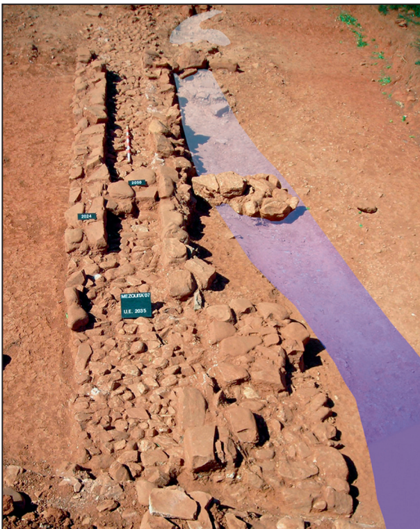
3. Vista canal y cauce.