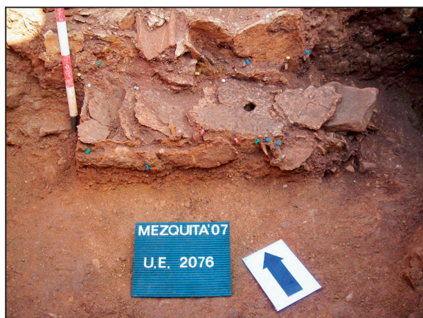
5. Vista restos rueda hidráulica.