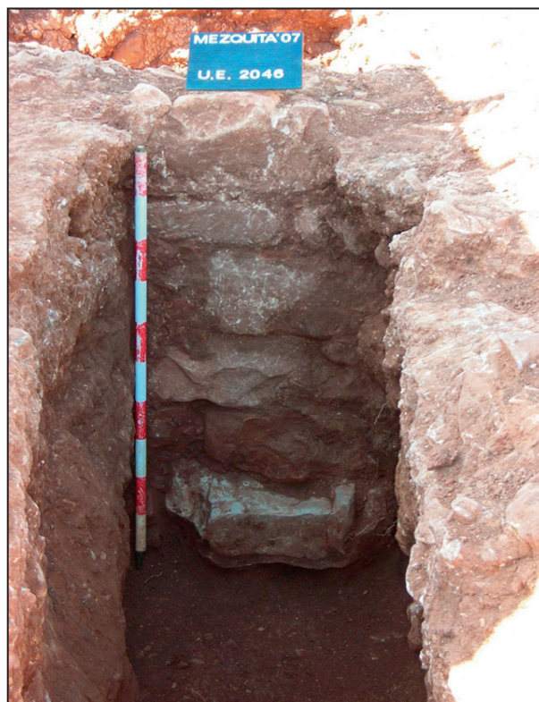
6. Vista sifón.