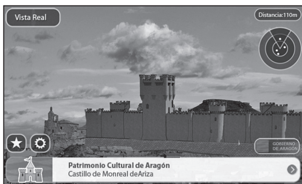
Figura 2. Aplicación de realidad aumentada sobre el castillo de Monreal de Ariza (Zaragoza)

superarán en inicio el número total de cinco lugares. Se ajusta esta moderada elección al tiempo efectivo que supondría su recorrido, que en ningún caso debe sobrecargar al interés del visitante, y desde luego a la contenida inversión económica que podrá plantearse al comienzo del proyecto. Serán indicados, en cualquier caso, los elementos secundarios y contenidos transversales que completen el paquete cultural.