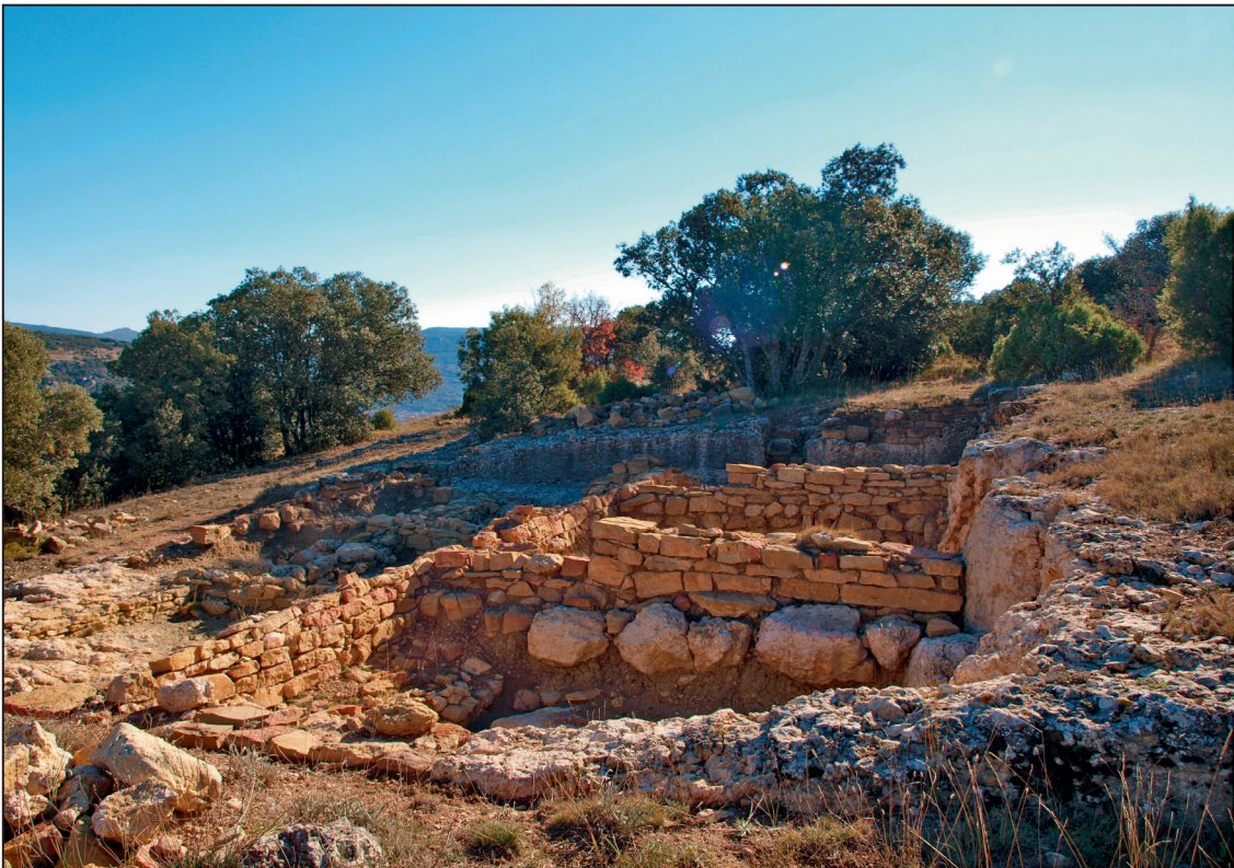
2. Estado del la Domus del Triclinium en el sitio arqueológico de Lesera (Forcall).