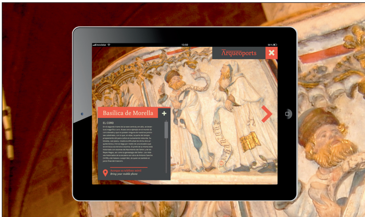
1. Prototipo de la aplicación ArqueoportS en uso sobre el coro de la Basílica de Santa María La Mayor (Morella).