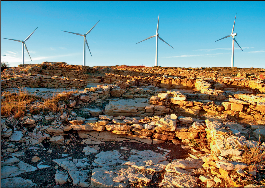
1. Vista general del estado del sitio arqueológico de la Loma Comuna (Castellfort)