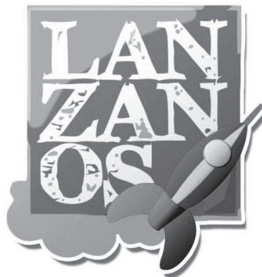
Figura 5. Imagen de la plataforma web Lánzanos.

Durante los dos meses naturales en los que se extiende este ejercicio, y para aquellos vecinos sin acceso a Internet, se dispondrá de un teléfono de información para conocer el estado de las donaciones, ya que –como dictan las reglas del crowdfunding – de no alcanzar en su totalidad la