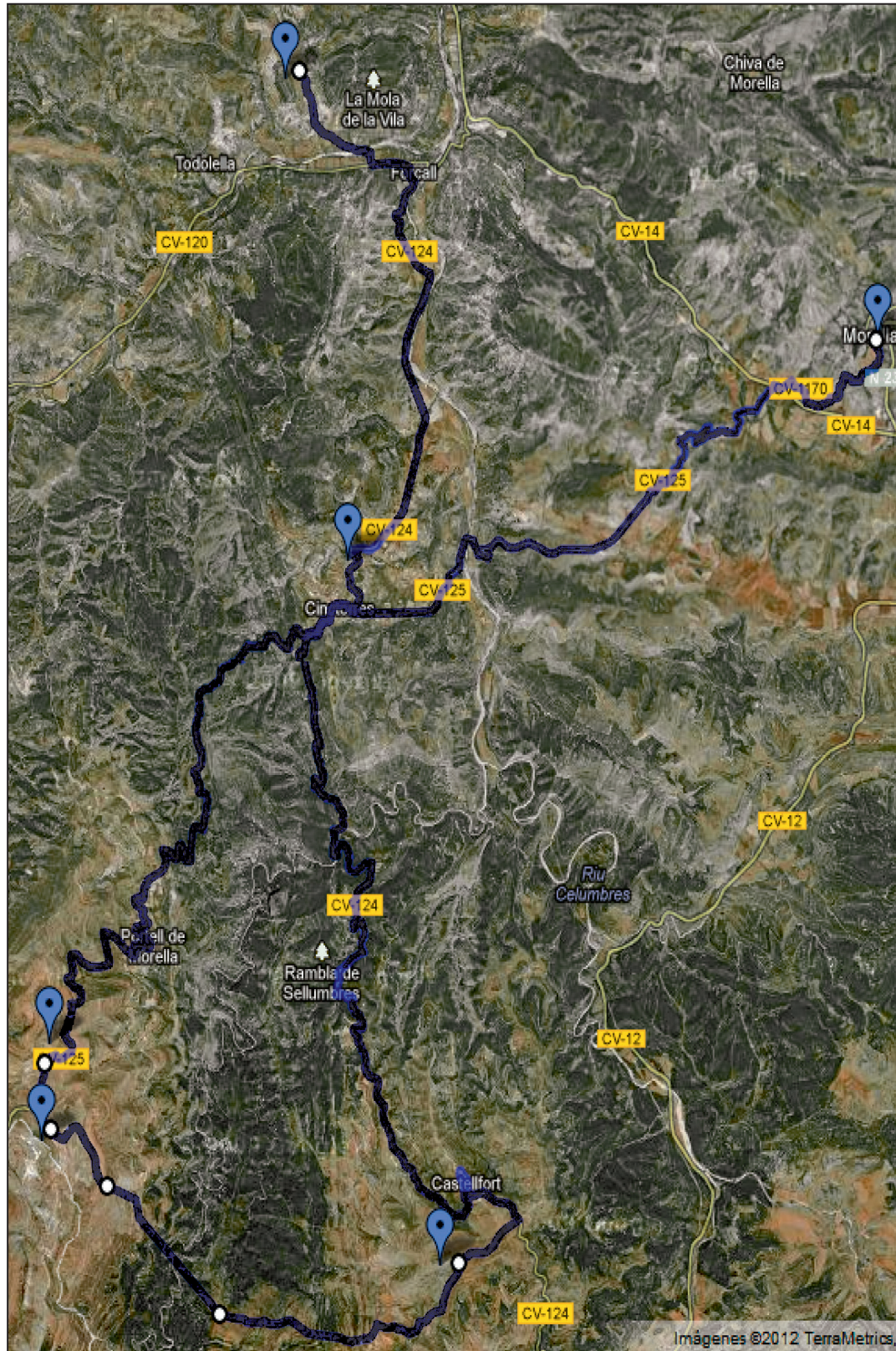
1. Trazado de la ruta circular propuesta, con inicio en la ciudad de Morella y parada en cada uno de los cinco sitios arqueológicos referidos.