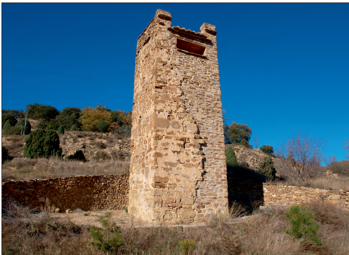
2. Vista general de la Torre dels Moros (Cinctores) tras su última restauración.