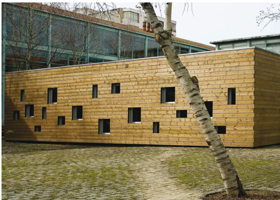
Figura 1. Cubo. Espacio destinado a la docencia en el sector Moda, en la Facultad de Bellas Artes de Pontevedra

Rocío Gómez-Juncal 1 Cristina Varela Casal 2 Dolores Dopico Aneiros 3