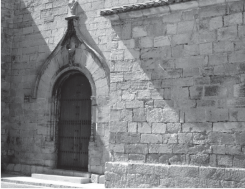
Portalada de l'església parroquial de Sant Salvador de Vimbofí.