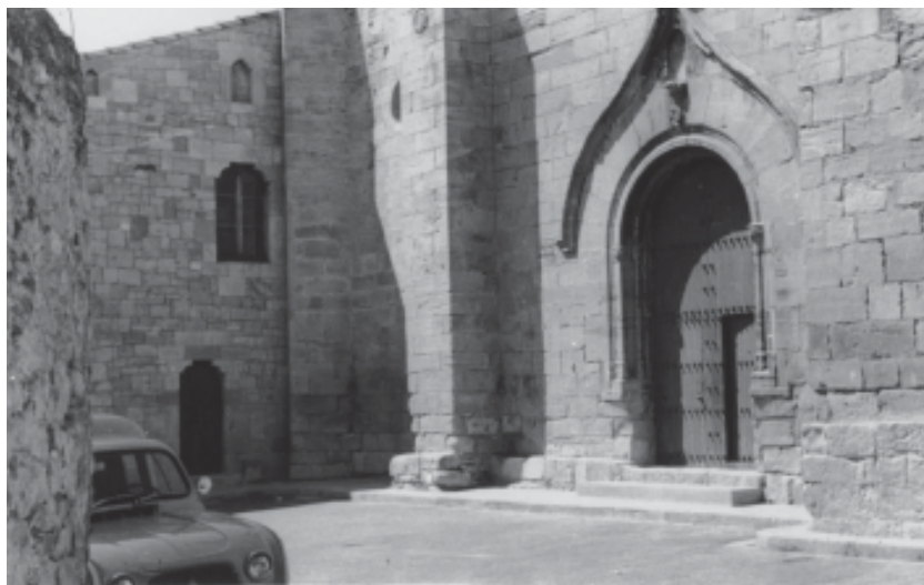
Portalada de l'església de Vimbodí