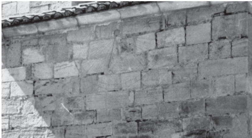
Rellotge de sol en una de les façanes del temple

Amb tot, la presència de mestres i picapedrers occitans, gascons, llemosins, borgonyons o bascos no era estranya a la nostra comarca al segle XV: a Blancafort els hem pogut documentar 13 treballant pocs anys abans de la Guerra Civil catalana. El conflicte bèl·lic els allunyà fins al darrer quart del mateix segle. En aquest entorn haurem de situar, doncs, la construcció del temple vimbodinenç.