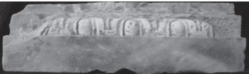
Fig. 4. Revers del fragment de fris.