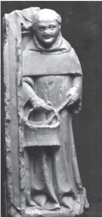
Fig. 1. Figura d'un frare, procedent de Poblet.

Pel que fa als fragments dels panteons, molts es van perdre per sempre. Alguns dels més interessants van acabar en mans d'antiquaris i finalment van ser adquirits per diversos museus. La resta va ser recollida per algunes instàncies oficials, cas de la Comisión Provincial de Monumentos , que en 1854, amb la intenció de salvar els fragments escultòrics, els va traslladar fins a Tarragona, de forma maldestra. Van quedar oblidats a l'Ajuntament. Al final del segle XIX van passar al Museu Arqueològic de Tarragona. Amb la intervenció d'Eduard Toda i la creació del Patronat de Poblet l'any 1930 es va iniciar un projecte de rehabilitació del monestir, que va culminar, pel que respecta als panteons reials, en la seva reconstrucció per part de l'escultor Frederic Marès, una actuació que va comprendre la inclusió de molts dels fragments originals. 2