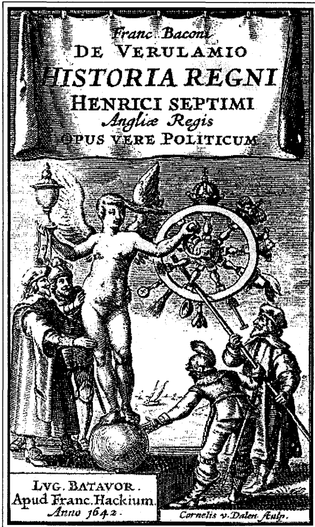
Figura 1 La Fortuna y los aduladores