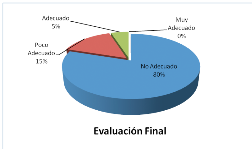
Fig. 2. Evaluación final de los OA según las escalas

El gráfico de la figura 2 muestra los porcentajes representativos de la evaluación realizada a los veinte OA. Teniendo en cuenta los rangos de la escala puede apreciarse que el 5% corresponde a un OA evaluado como adecuado, el 15% representa la evaluación de tres OA como poco adecuados. El restante 80% (dieciséis OA) están evaluados como no adecuados. Ninguno alcanzó el rango superior de la escala (muy adecuado). Estos resultados permiten demostrar la importancia de la utilización de la guía de evaluación para determinar el nivel de la calidad de los OA, tanto en cada una de las etapas por las que transita el OA como al final de su trayecto, según el modelo de producción empleado colaborativo o individual.