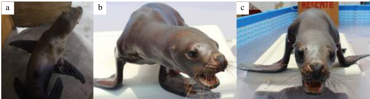
Figura 4. Postura de advertencia (a) + Vibrisas de advertencia (b) + Mordida (c) de Otaria flavescens en la base de rehabilitación de ORCA.