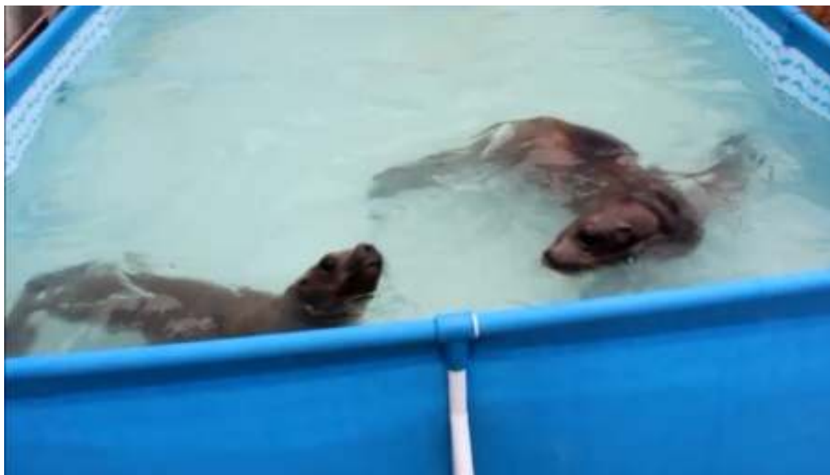
Figura 6. Persecución de Otaria flavescens A hacia U.