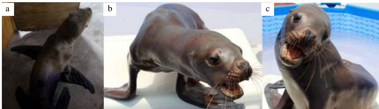
Figura 3. Postura de advertencia (a) + Vibrisas de advertencia (b) + Vocalización agresiva (c) de Otaria flavescens en la base de rehabilitación de ORCA.