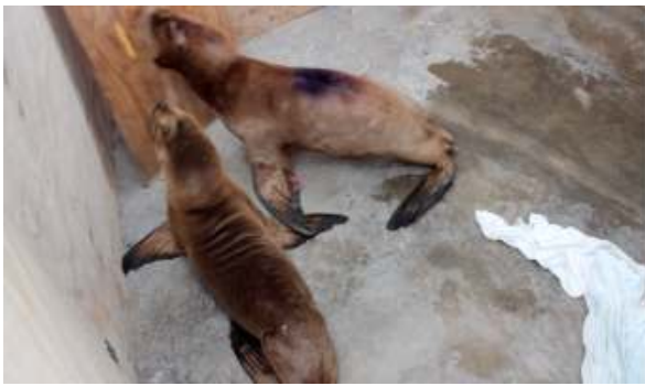
Figura 8. Prueba 2, ya se observan conductas de cooperación, como Carga + Escape.