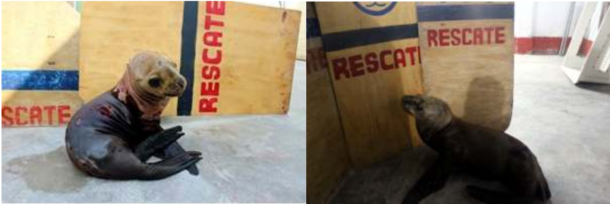
Figura 7. Prueba 1, ambos lobos están aislados uno del otro, sin buscar cooperación ante la presión de los escudos.