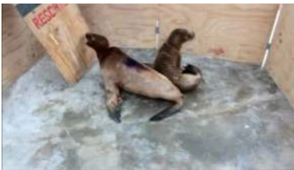
Figura 10. Prueba 4, A detiene el escudo dirigido hacia U, en otra demostración de Carga + Escape.

La Tabla 6 nos muestra que la cooperación entre ambos individuos aumentó en el tiempo, lo que observamos a través de las pruebas de interacción con humanos.