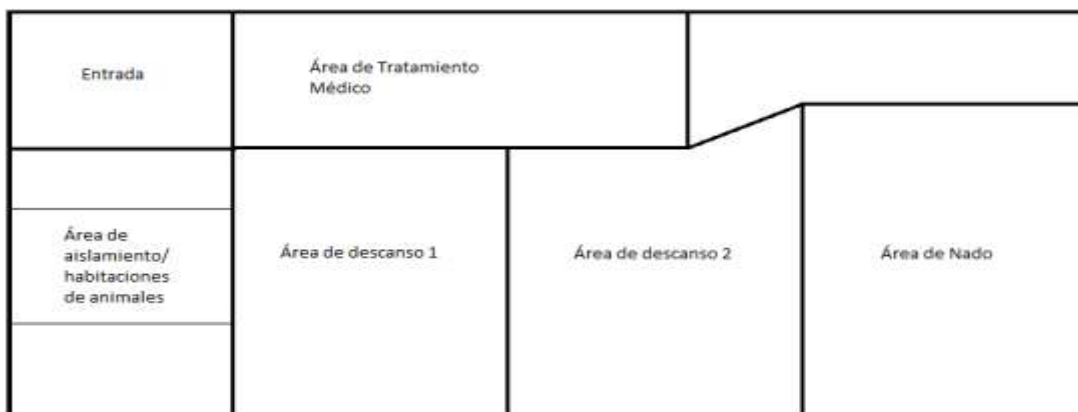
Figura 2. Esquema de las áreas de rehabilitación de la base de ORCA usadas en esta investigación.

Luego de que ambos animales pasaron a la fase cuatro de rehabilitación (en la cual ya no tenían problemas de salud y que sólo tenían que recuperar su peso), se los hizo interactuar (compartieron ambientes) en las áreas de descanso, nado (piscina) y tratamiento médico (Fig.2), con la única excepción del área de aislamiento/habitaciones de animales.