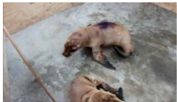
Figura 9. Prueba 3, se observan comportamientos de cooperación aún, como Carga + Escape.