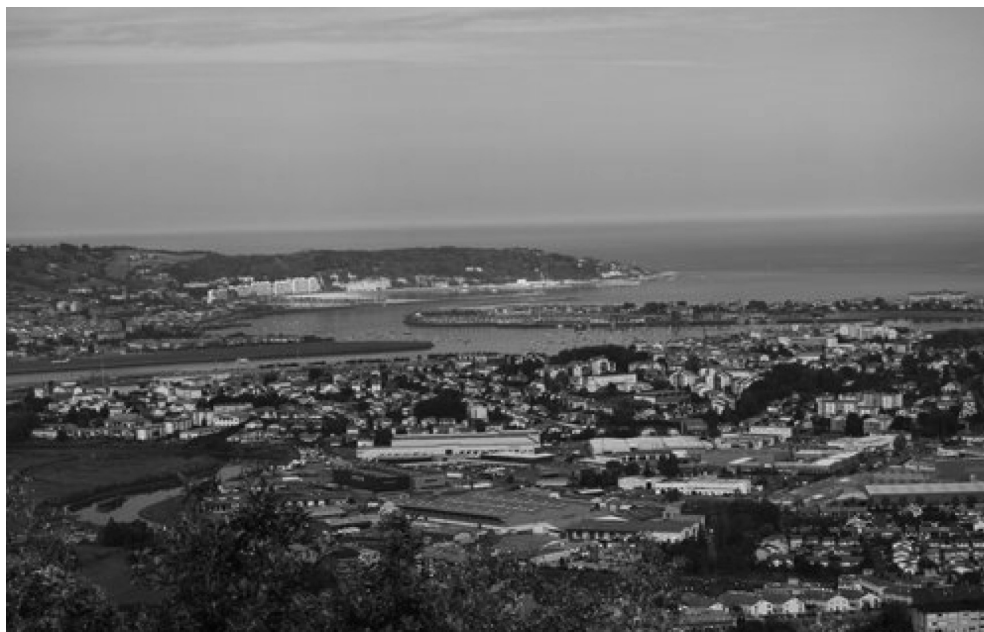
Figura 1. Bahía de Txingudi.