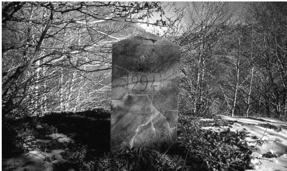
Figura 2. Mojón 294, situado al norte del Paso de Aspe. Es un ejemplo de mojón de mampostería.