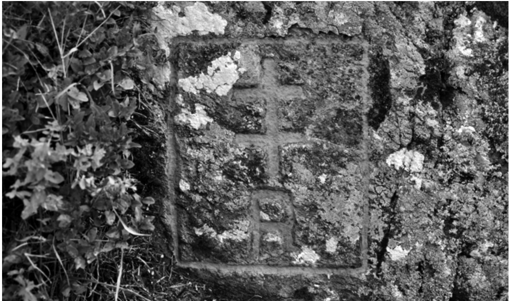
Figura 3. Doble cruz R grabada en roca en la zona situada entre Arres y Bagnères-de-Luchon.