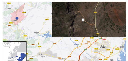
Figura 1 | Mapa de localització de l'urpa, a la Peña, Argelita (l'Alt Millars).

afloraments de dos nivells susceptibles de contenir fòssils continentals (fig. 2). En primer lloc, a prop de la zona de la troballa, venint d'Argelita per la carretera CV-193, abans d'arribar al entrador de la pista es travessa una franja estreta de l'Albià, C 16 , segons la notació de l'IGME (1974), "una formació eminentement detrítica, con abundancia de arenas y areniscas de color blanco a ocre,..." En segon lloc, a l'oest del punt on es va fer la troballa (fig. 2) i apegat a una falla, hi ha un aflorament de la faciès Weald, d'edat Neocomià-Barremià, C w11-w14 , "serie detrítica constituida por arcillas rojo-vinosas o gris verdosas, bancos d'arenisca blancas o amarillentas ..." (IGME, 1974).