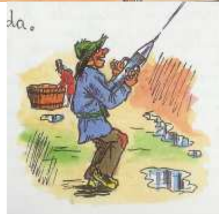
Il·lustració d'un xeringaire en plena actuació