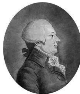
Figura 1. Antoine-François Fourcroy.

En su artículo sobre los arseniatos, 2 Chenevix mencionó que había una gran disparidad entre los valores reportados en la bibliografía acerca del contenido de azufre en las piritas. Chenevix creía que el error se debía a una combustión parcial y acidificación del radical por el ácido nítrico empleado para disolver el mineral, lo que dejaba parte del ingrediente sin reaccionar. Según Antoine-François Fourcroy (1750-1809) (Figura 1), 3 100 partes de ácido sulfúrico contenían 71% azufre y 29% oxígeno, y de acuerdo a Lavoisier, 4 el sulfato de bario contenía 33% de ácido. Conforme a los datos de Lavoisier, el sulfato de bario debiera contener 23,43% azufre