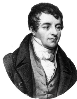
Figura 2. Humphry Davy.

El estado de la química en aquella época llevó a dos hipótesis respecto a la naturaleza del ácido oximuriático. Por una parte, Scheele imaginó que era muriático menos hidrógeno, por otra parte, Claude-Louis Berthollet (1748-1822) y