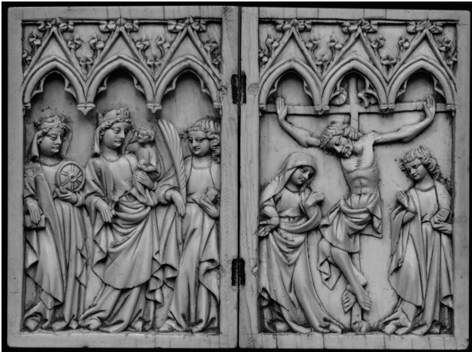
Fig. 5 Díptico de marfil tallado de la Congregació de l'Oratori de Sant Felip Neri de Palma en exposició permanent i con paralelos destacats en la colecció Samuel Courtauld de Londres