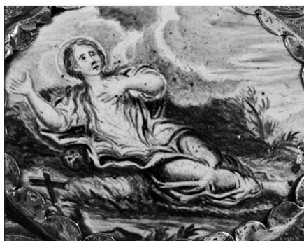
Fig. 11 Detalle de la placa de esmalte pintada