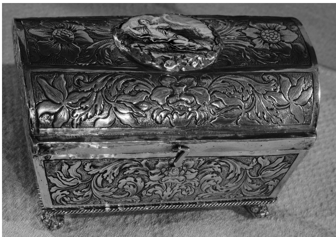
Fig. 9 Cofre de plata donde se guarda el relicario