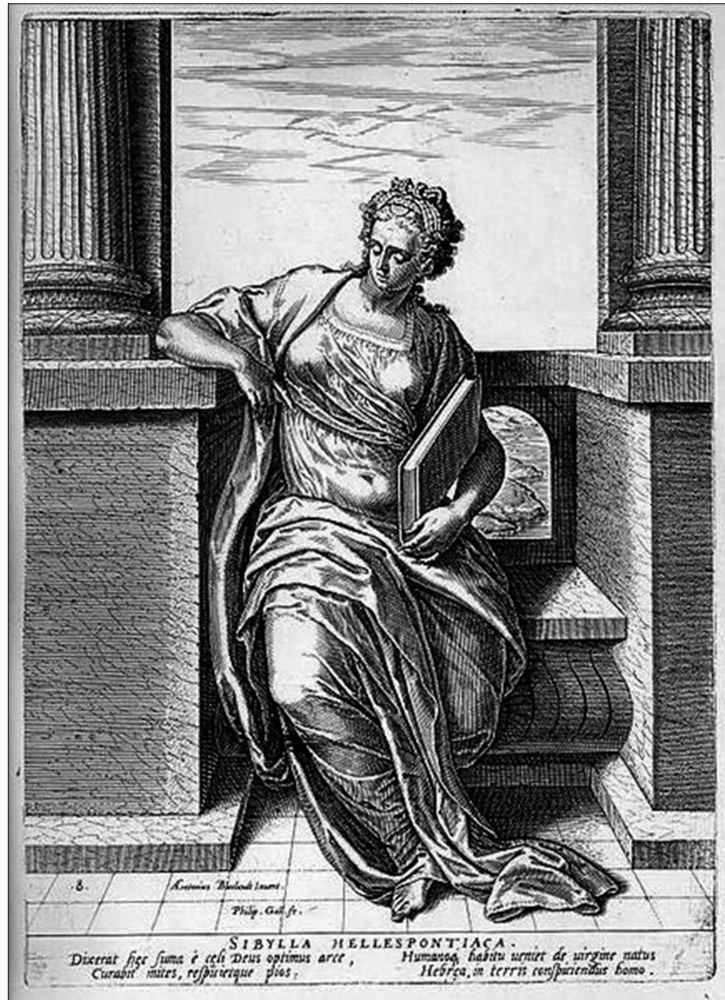
Fig. 12 Sibylla Hellespontica. Grabado de Philip Galle