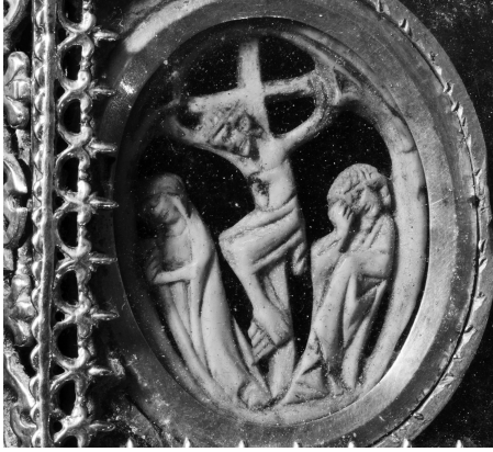
Fig. 3 Talla de marfil con el Crucificado. Lado izquierdo de la nuez