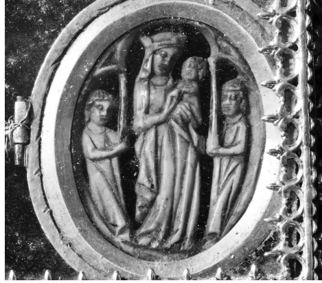
Fig. 4 Talla de marfil con la Virgen y el Niño. Lado derecho de la nuez