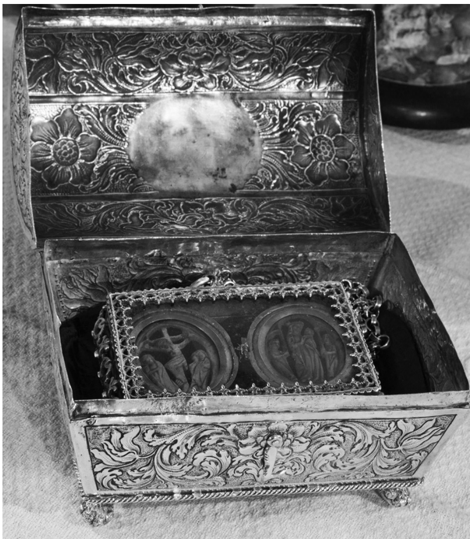
Fig. 2 El relicario del Sant Crist del Noguer en su baulillo