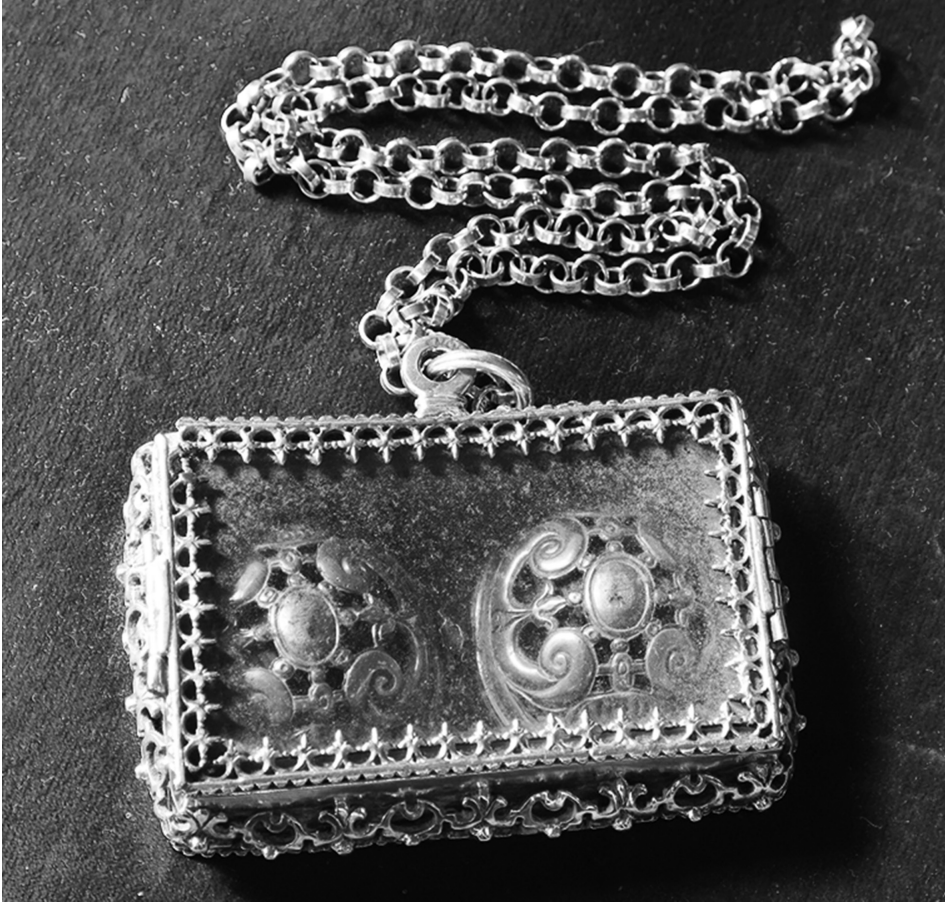
Fig. 7 Cara posterior del mismo estuche