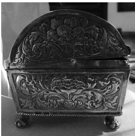
Fig. 10 Repujado de plata de un lateral del cofre