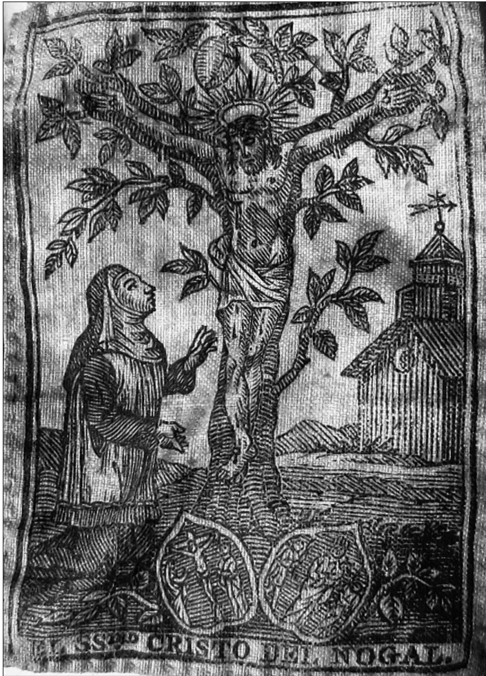
Fig. 1 Escapulario con la imagen del Sant Crist del Noguer. Colección particular