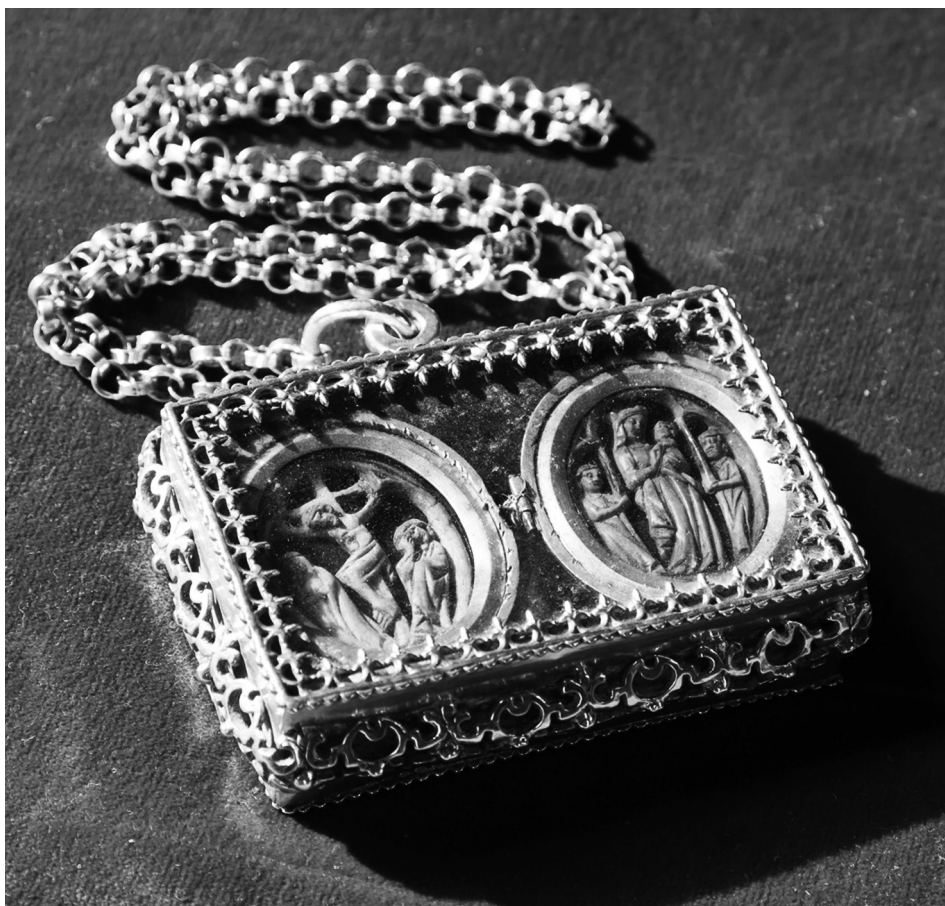
Fig. 6 Estuche colgante de viriles del Relicario de la nuez. Cara anterior