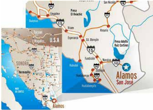
Figura 1. Mapa del Municipio de Álamos, Sonora.