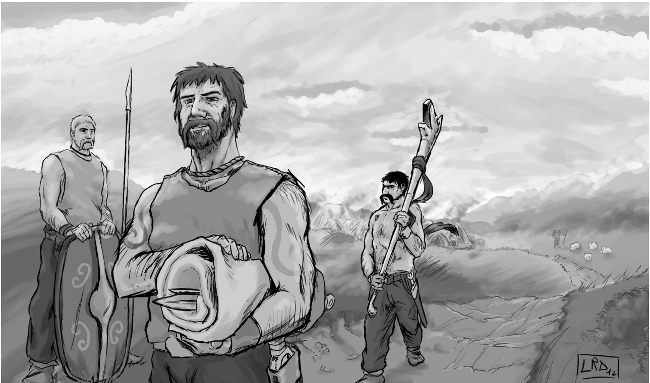
Fig. 2. Galos portando elementos para un depósito ritual (escudo, espadas y carnyx) / Ilustración: Luis Rodrigo

cia a la politización de los símbolos de la guerra y del banquete como medio de acceso al poder (Poux, 2004: p. 323). Esto explica que las armas fueran un elemento más de prestigio como signos de aparato, apareciendo en escenarios creados por las elites para involucrar al resto de la sociedad en actividades políticas, religiosas y sociales de prestigio.