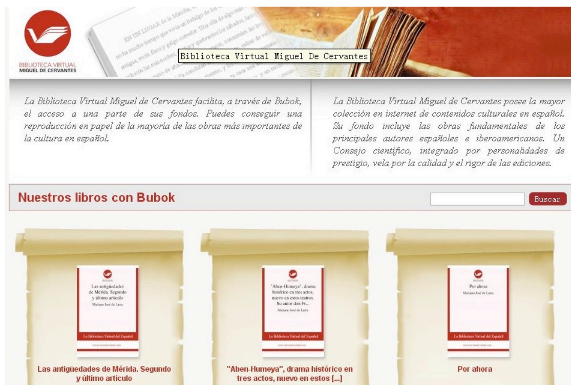
Imagen 7. Sitio web Biblioteca Virtual Miguel de Cervantes.

de la mayoría de las obras más importantes de la cultura en español". Estas ediciones, al carecer de copyright (y al no tener la Biblioteca objetivo de comercialización) se pueden adquirir a precios módicos: 1 euro como libro digital ( e-book ), 5 euros en formato papel (encuadernado). Éste es un servicio valiosísimo para lectores e investigadores, que pueden disponer en sus casas del mismo libro que podrían consultar en la Biblioteca.