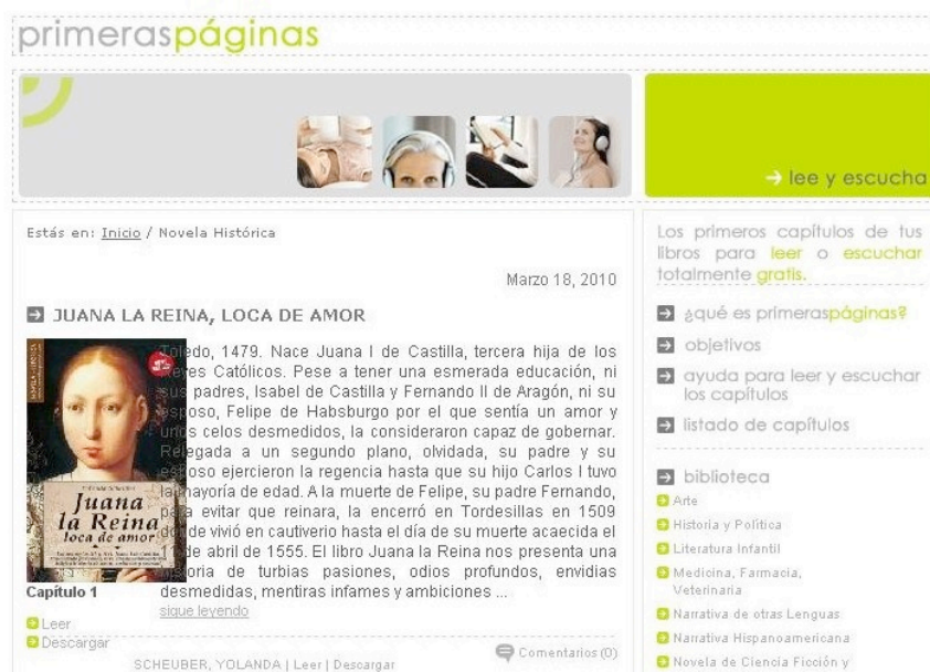
Imagen 5. Sitio web Primeras Páginas.

Esta web también da la bienvenida a las editoriales que quieran promocionar sus publicaciones, siempre que estén en venta en Casadellibro.com. Es evidente que esta cooperación entre las editoriales y la web atrae a los lectores a consumir en Casadellibro.com. En este sentido, aunque el servicio de Primeraspáginas.com es totalmente gratuito, se trata de un instrumento relevante para la venta de libros. Si buscamos en Google Books las ediciones del Grupo Planeta , veremos que sólo se puede acceder a muy pocos fragmentos o que, directamente, la vista previa no está disponible.