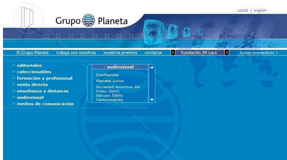
Imagen 3. Sitio web del Grupo Planeta.

Para finalizar, dentro del sitio se puede acceder también a un buscador interno, así como a notas de prensa relacionadas con la actuación de Grupo Planeta . Se trata de un sitio web rizomático, con una estructura de cajas chinas, dinámico y con una organización que permite navegar cómodamente dentro del propio sitio o en ventanas hermanas. Su estructura refleja, de algún modo, el alcance de su poderío comercial.