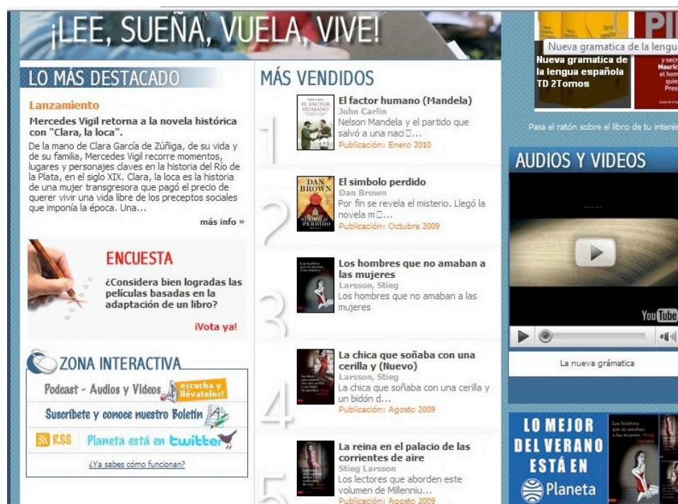
Imagen 4. Sitio web Editorial Planeta Uruguay.

Si nos concentramos en el segmento que nos interesa, la edición de libros, vemos que sus libros se imprimen bajo la dinámica del best-seller . De acuerdo con Gomez. Escalonilla, “la solución que propone el sector para que a pesar del desajuste entre oferta y demanda éste siga contando con balances positivos es la dinámica del best-seller , es decir, concentrar los esfuerzos de promoción y venta en unos pocos títulos que compensan con sus compras millonarias las escasas o nulas ventas del resto de la producción (...) El problema de esta dinámica, la de la concentración en los más vendidos es que perjudica a los otros libros y los autores que menos venden frente a los más reconocidos, mediáticos o premiados” (Gómez Escalonilla, 2007). Esto podemos comprobarlo, por ejemplo, si accedemos a una de las ventanas a la que direcciona el portal de su casa matriz barcelonesa, la filial de Editorial Planeta en Uruguay. En sus páginas, aparecen promocionados los más vendidos (ver, por ejemplo, http://www.editorialplaneta.com.uy/ ). A pesar de publicar títulos nacionales, vemos una amplia sección donde se promocionan los best-sellers ordenados por ranking de ventas, ninguno de ellos uruguayo: ellos son el norteamericano Dan Brown, el sueco Stieg Larsson y el británico John Carlin.