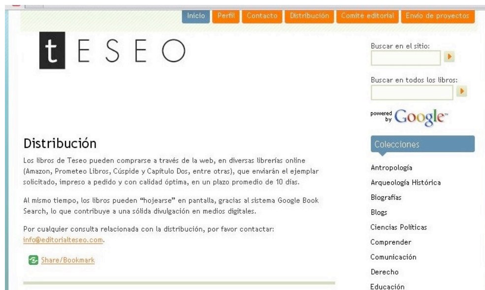
Imagen 1. sitio web Editorial Teseo.

Su portal http://editorialteseo.com/ tiene formato de blog, con entradas correspondientes a los días en que el contenido ha sido posteado y solapas temáticas organizadas en el margen derecho por Colecciones , Categorías y Archivos .