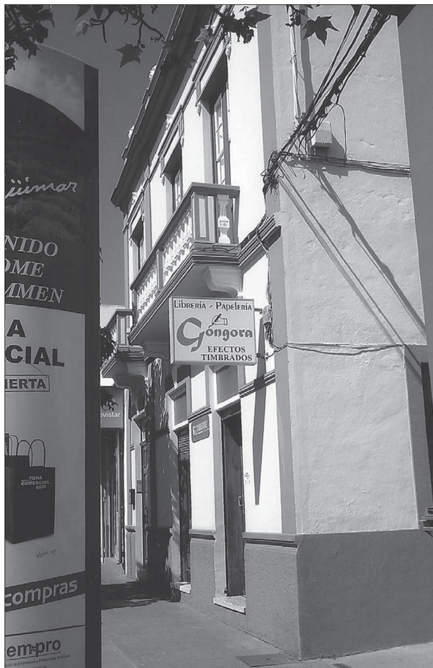
Sede de la Librería-Papelería Góngora, frente al Cinema Los Ángeles.