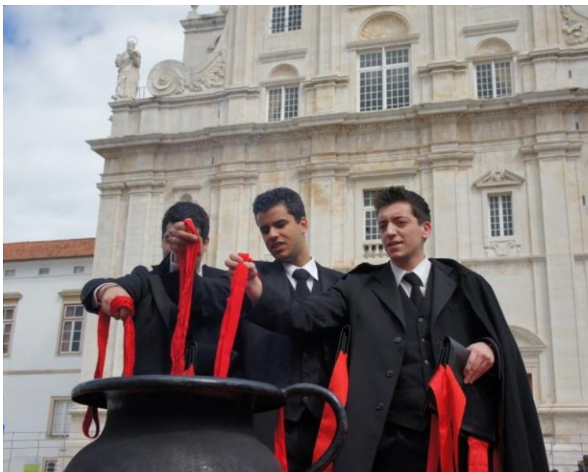
Figura 6: Grelo e fitas: insignias académicas e símbolos rituais