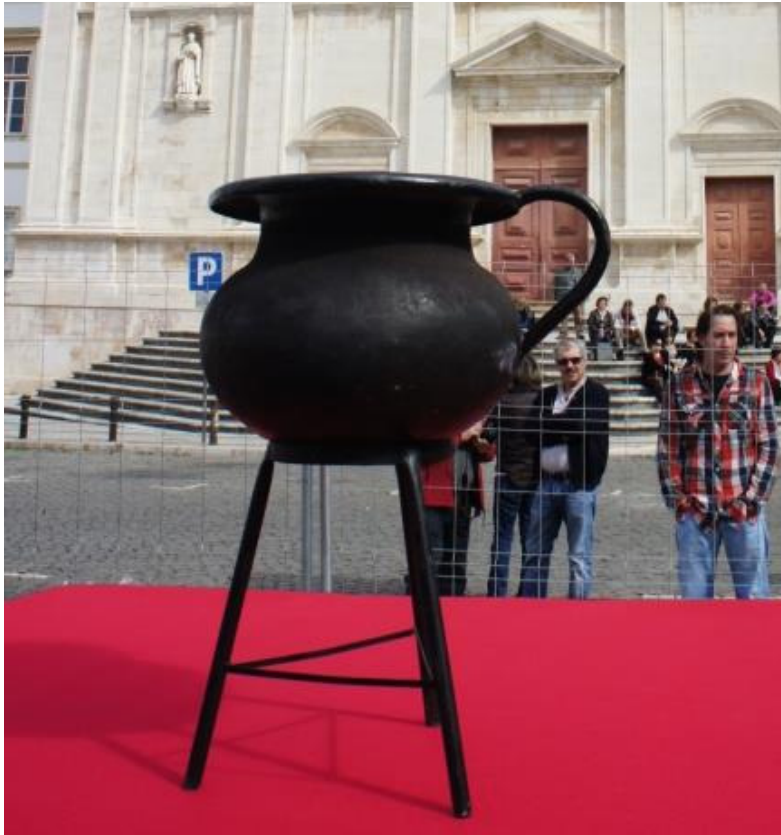
Figura 5: Utensílio em formato de pinico: elemento ritual da Praxe Académica Fonte: Acervo pessoal de Cruz, M. T. J. O. – Queima das Fitas 2012