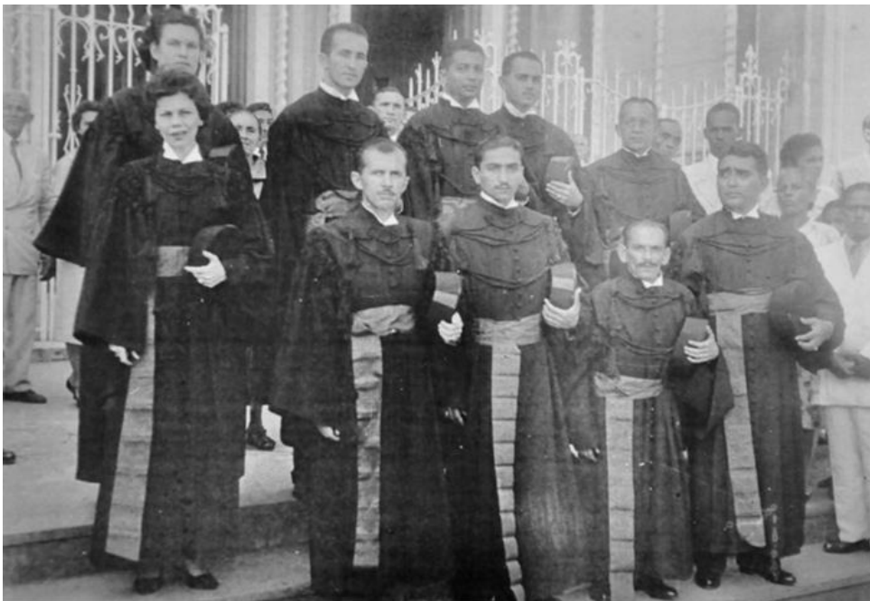
Figura 3: Missa de Formatura da primeira turma de Bacharéis da Faculdade de Direito de Sergipe

Outro símbolo presente, o da Faculdade, constava da bandeira, flâmula, álbum, quadros e placas de formatura. Nas imagens a seguir vê-se parte da primeira turma de formandos da Faculdade de Direito a utilizar suas insígnias e capelo e borla utilizados pelo Diretor da Faculdade, durante o juramento de um formando.