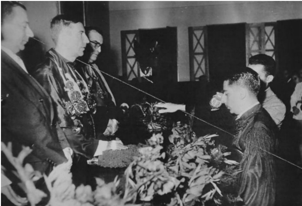
Figura 4: Concessão do grau da primeira turma de bacharéis da Faculdade de Direito de Sergipe