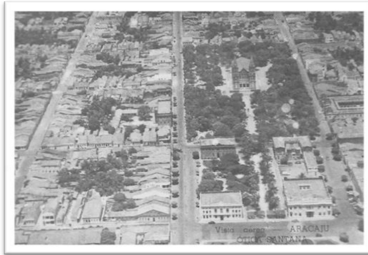
Figura 2: Vista panorâmica do Centro de Aracaju, Capital de Sergipe, no final da década de 1960. Acervo: Memorial de Sergipe – Universidade Tiradentes – Sergipe

O ato que definiu em 28 de fevereiro de 1950 a instituição de uma Faculdade de Direito em Sergipe foi precedido de convocação pública a todos os juristas e outros intelectuais locais. A reunião ocorreu no Conselho Penitenciário, entidade de grande prestígio junto ao governo do Estado naquele momento e que se situava em Aracaju, Capital de Sergipe. 32