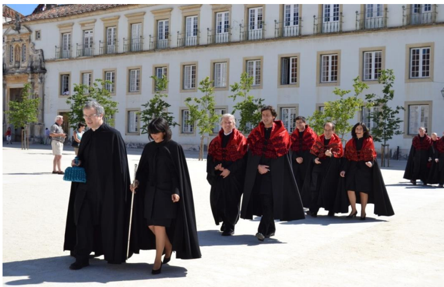
Figura 7: Formação do Cortejo – Imposição de Insígnias Doutorais da Faculdade de Direito