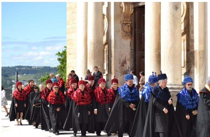
Figura 8: Cortejo em solenidade Imposição de Insígnias Doutorais da Faculdade de Direito

É importante asseverar que a sequencia ritual da Imposição de Insígnias e dos Doutoramentos Honoris Causa realizados em Coimbra guardam em algum ponto semelhança com as solenidades da mesma natureza realizadas em diversas Universidades europeias, todavia, diferenciam-se do extinto ritual adotado no final do século XIX e anos iniciais do século XX para a concessão do grau de bacharel, na Universidade de Coimbra.