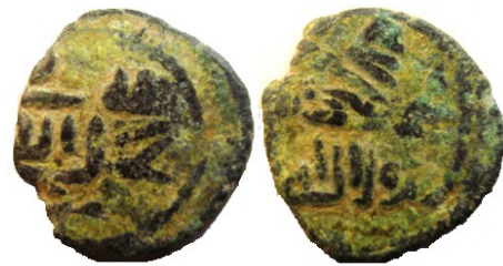
19,50 Ø x 1,70 mm. 3,05 g. Sobre P.120 se ha acuñado el felús Walker #683/4