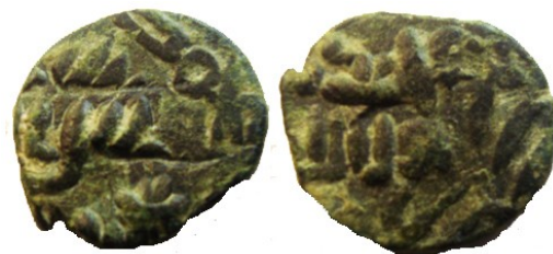
16,60 Ø x 2,70 mm. 3,90 g. Como en el anterior, sobre P.120, se ha acuñado Walker #683/4

De estos dos ejemplos resulta evidente que la acuñación de P. 120 fue anterior a la de Walker-683/4 .