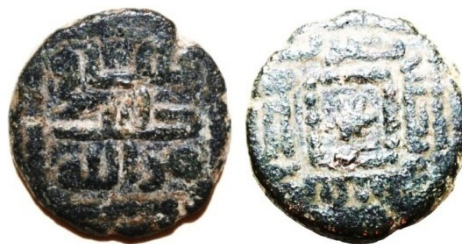
Colección particular, peso 4,05g; diámetro 12mm.

Walker 26 refiere que la leyenda نفاق طيب عن الله؟ (mantenemos el signo de interrogación incluido por Walker), procede de una única moneda localizada en el Museo de Berlín, y cuya lectura no es clara; a ella debe corresponder la imagen B. 52 de la lámina XXVIII., imagen que muestra una moneda con alguna parte de leyenda no visible 27 . Asocia el contenido de esta leyenda con el de la leyenda نفقة في سبيل الله y los supone equivalentes. Todo orbita alrededor de la palabra “ nafaqa ” cuyo significado no le ofrece ninguna duda: Nafaqa was the pay given to warriors, who went forth to fight “in the Way of Allah”, i.e. to take part in the Jihad, or Holy War against the infidels. Sin embargo, observando un ejemplar con leyenda más completa, puede afirmarse que lo expresado se aleja radicalmente de esa causa tan noble que es “perseguir infieles”.