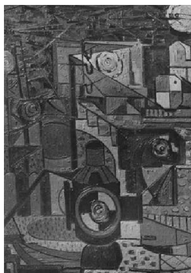
Fig. 4. Juan Guillermo, Nocturno en la Estación de Villalba , Madrid, 1957.

Y es que se manifestará después la tendencia constructiva, que alternará con una visión más expresiva y asimismo un denso empaste de pintura. Nocturno en la Estación de Villalba figuraba en el n.19 del catálogo de la muestra de la Dirección General de Bellas Artes, 1956, junto con otras dos obras 22 , como así declaró el artista en entrevista radiofónica a Campoy (Nuez, 1982: 124-126), y con el nº V en el catálogo de la muestra individual del Ateneo en 1957.