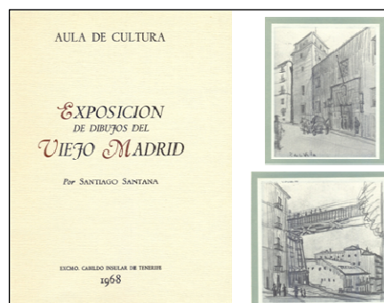
Fig. 2. Portada Exposición de Dibujos del Viejo Madrid por Santiago Santana, 1968, y dibujos interiores de Plaza de la Villa y El Viaducto .