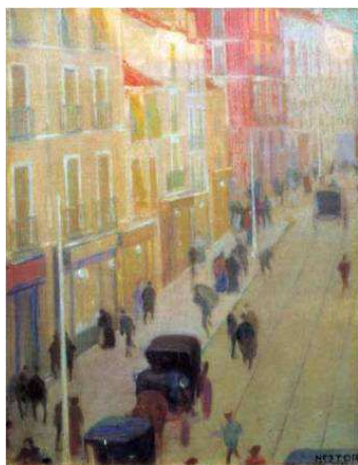
Fig. 1. Néstor de la Torre. Calle Mayor de Madrid (1904). Ó/l, 46x37cm.

Néstor Martín Fernández de la Torre (Las Palmas de Gran Canaria, 1887 - 1938) había recibido en 1899 en Las Palmas las primeras orientaciones artísticas del maestro Eliseo Meifrén. Aunque su importancia y proyección trasciende no sólo el ámbito isleño y nacional sino la propia actividad plástica 9 , no debe olvidarse su corta estancia en Madrid entre 1902 y 1904 para ampliar su formación. Recibe una pensión del Ayuntamiento de Las Palmas para estudiar en la Escuela de Bellas Artes y entra en el taller del artista andaluz, pintor y restaurador Rafael Hidalgo de Caviades (1864-1950).