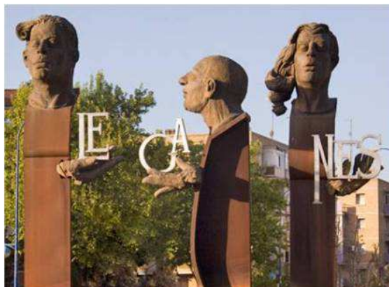
Fig. 8. Juan Bordes, Fuente de Leganés (1997), Avda. Fuenlabrada.

En el año 2000, el Ayuntamiento de Leganés con el Museo Nacional Centro de Arte Reina Sofía acuerdan trasladar, en calidad de depósito, al Museo de Leganés parte de las esculturas monumentales que aún quedaban 43 en los antiguos jardines del Museo Español de Arte Contemporáneo en Madrid (MEAC). Entre ellas la pieza de Martín Chirino Mediterránea III (1971, acero inoxidable, 180 x 425 x 110 cm.) con fecha de depósito en Leganés 2000-2001. La obra está en la misma línea que otra Mediterránea (1972, acero pintada al duco, 150 x 370 x 50 cm), en la fuente que se sitúa a un extremo y debajo del puente del Paseo de la Castellana, Museo Arte Público de la Castellana. La pieza de Chirino cobra sentido en relación con el conjunto de las esculturas que allí se exhiben: la representación plástica de los distintos elementos de la naturaleza. Formas curvas que se extienden en horizontal y que se corresponden con el movimiento ondulante del agua, evocan el mar, la luz del Mediterráneo (Grecia).