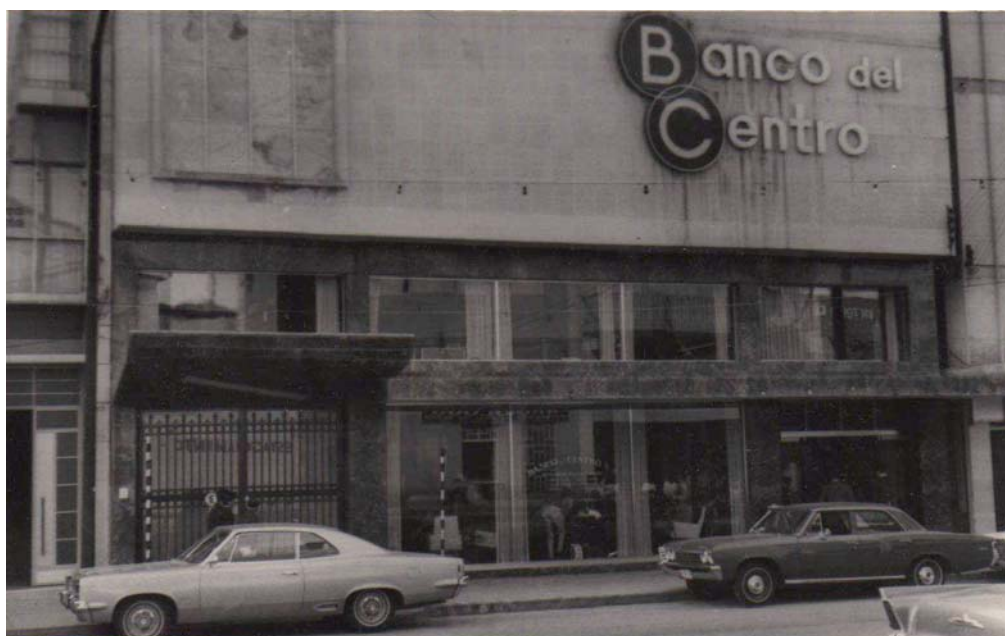
Fig. 2. En la Avenida Madero se construyeron diversos edificios habitacionales y comerciales con rasgos modernistas en su diseño espacial y en sus fachadas, como el que ocupó el Banco del Centro.

El movimiento moderno impactó la forma de construir y Ortega Douglas erigió diversas casas en la vialidad de moda de la época: Avenida Madero. Esta avenida en realidad no fue trazada sino hasta el siglo XX, con motivo de la Soberana Convención Revolucionaria, celebrada en Aguascalientes en el año de 1914. En relación a la datación del trazo de la Avenida Madero, Ramírez menciona: ...en los meses de agosto a noviembre de 1914 se realizaron varias obras. Se abrió la Avenida de la Convención (hoy avenida Francisco I. Madero), así como las calles de Persia (hoy General Barragán) y la de Mina... (2003: 98).