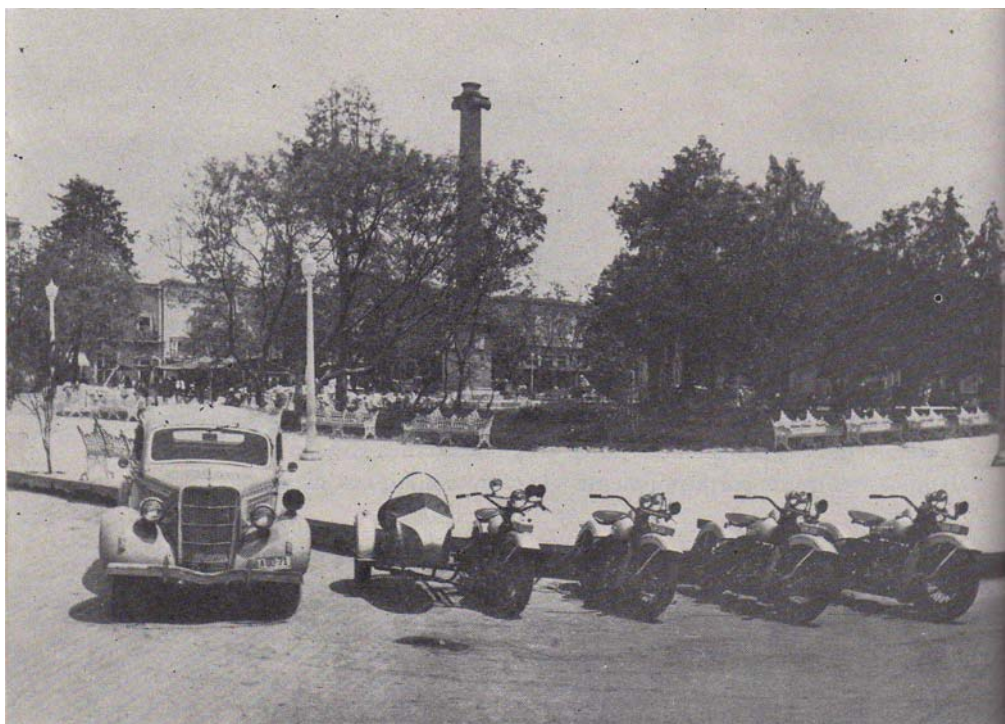
Figura 4. Exhibición de flamantes patrullas de tránsito en la Plaza Principal, año de 1948.