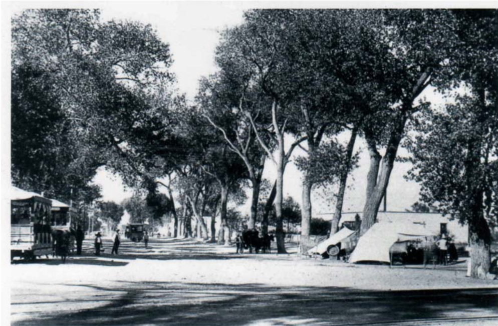
Fig. 1. La Alameda conformaba una ruta obligada de tranvías a principios del siglo XX.

Era entonces Ortega Douglas heredero de un linaje altamente productivo y ejemplar. Ortega siguió el ejemplo de su padre y demostró también sobradas habilidades para transformar el ambiente edificado, mejorando el funcionamiento de la ciudad de Aguascalientes, justo a mediados del siglo XX.