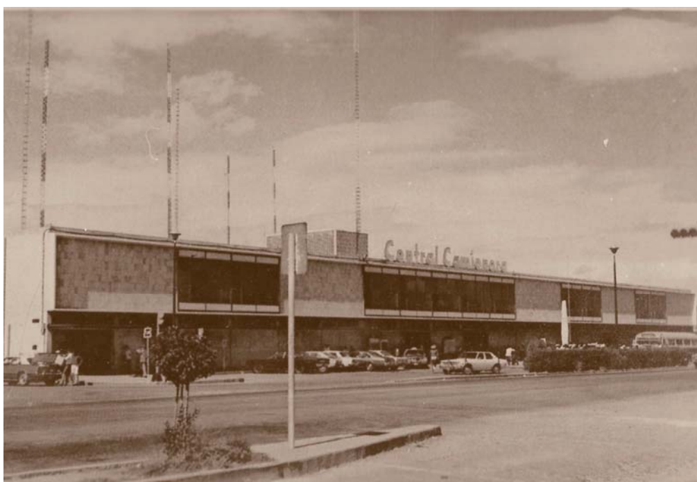
Figura 5. Durante la década de los años setenta se urbanizó por completo el primer anillo de la ciudad de Aguascalientes (ahora Av. de la Convención 1914), en el cual también se construyó la Central Camionera.

ricos no son diseños exclusivos de Aguascalientes, son un identificador básico en la morfología de esta ciudad; sin embargo al ver que un anillo no era suficiente para la ciudad Ortega Douglas propone un segundo anillo 2 . De modo que, aunado al crecimiento de la ciudad en forma concéntrica al casco antiguo Ortega aporta el trazo de la Avenida Oriente-Poniente (Av. López Mateos), el eje Norte-Sur (Av. Héroe de Nacozari) y los primeros dos anillos que cercaron y bordearon Aguascalientes en su momento. La insistencia de reducir espacios abiertos en la ciudad y colmatarla con construcciones ha repercutido en una paulatina asfixia al medio ambiente, reflejado esto en una limitada cantidad de áreas verdes en el centro de la ciudad.