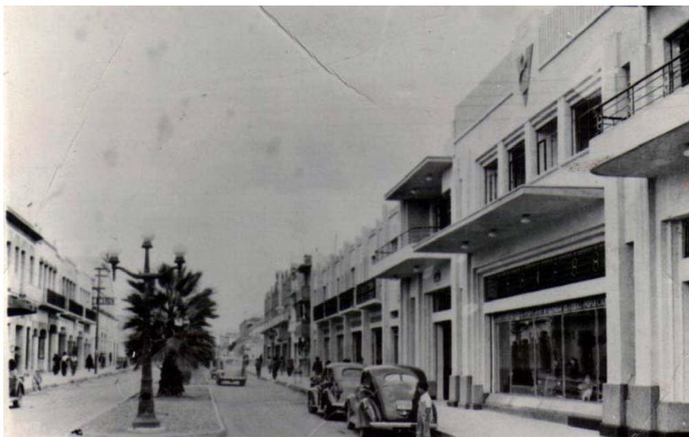
Figuras 6. En la Avenida Madero se observa el movimiento moderno en su máxima expresión

miento artístico moderno en la Avenida Madero (ver Fig. 6), la cual recientemente cumplió 100 años desde su fundación e incluye valiosos ejemplares del Neocolonial, Neobarroco, Art Deco , Funcionalismo y otros movimientos artísticos característicos del siglo XX.