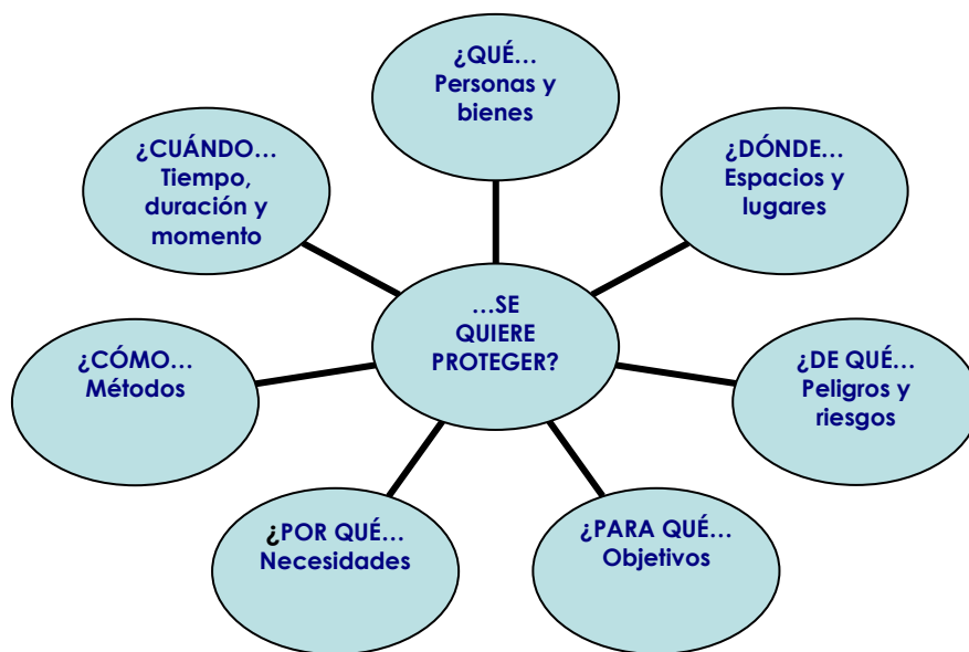
Figura 2. Aspectos de la gestión de la seguridad en la actividad físico-deportiva

En vista de tales aspectos, y de la complejidad que éstos suponen en el contexto escolar, y más concretamente en el área de Educación Física, es lógico pensar que las situaciones de riesgo forman parte del día a día. Sin embargo, existe la posibilidad de prevenirlas y minimizarlas poniendo las medidas necesarias. Albornoz (2002) afirma que “más vale pasar por el miedo del club o de la Escuela que tener que enfrentarse a un padre que viene a pedir explicaciones por el accidente que ha tenido o la muerte de su hijo” (p. 196).