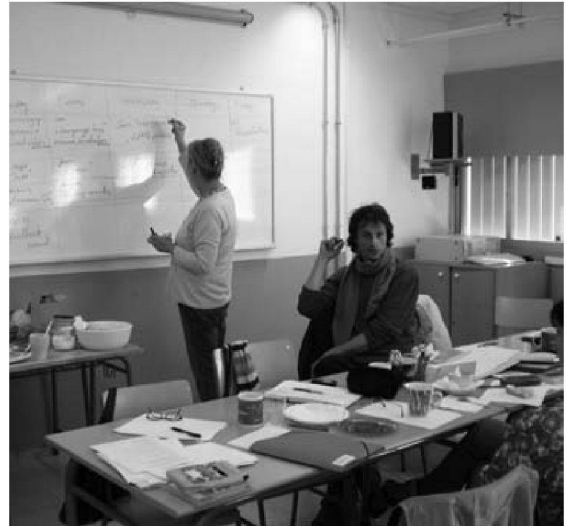
Reunió a Landsberg am Lech. Abril 2008. Aula europea.

L'aula europea es va plantejar com a activitat final del projecte. Durant la setmana que va durar l'experiència es varen reunir un total de setze alumnes que provenien dels cinc països participants. La intenció era provar amb ells les noves metodologies utilitzades a cada un dels centres en aquests anys de projecte.