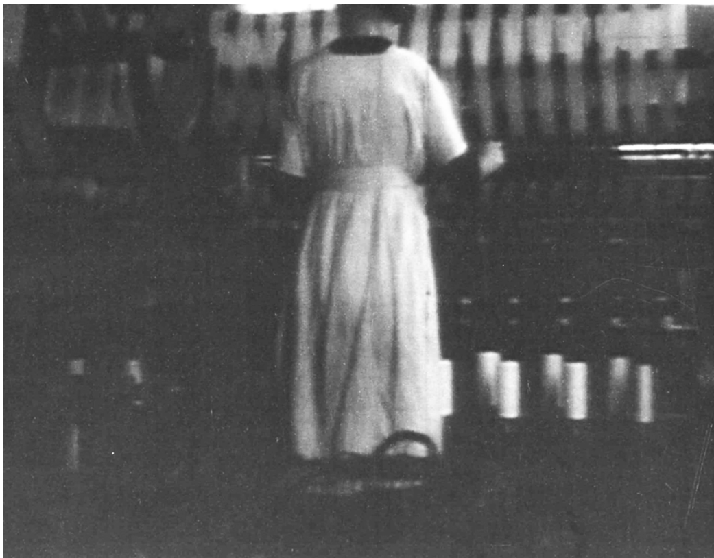
..... Detalle de Soledad y compañía de Hannah Collins. Videoinstalación.