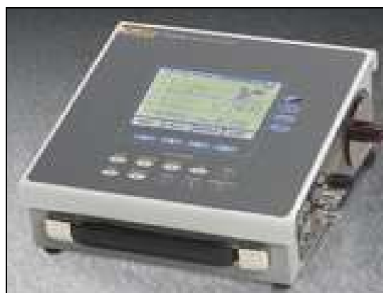
Figura 2. Analizador de Flujo de Gas Bidireccional: FLUKE BIOMEDICAL VT-PLUS HF

El VT PLUS HF, es un analizador de flujo de gas para uso general, evalúa la presión, el flujo y el volumen entregados por una variedad de dispositivos. El VT PLUS HF ofrece los modos especiales diseñados específicamente para probar los ventiladores de pacientes mecánicos, incluyendo los ventiladores oscilatorios de alta frecuencia (HFOV). [7]