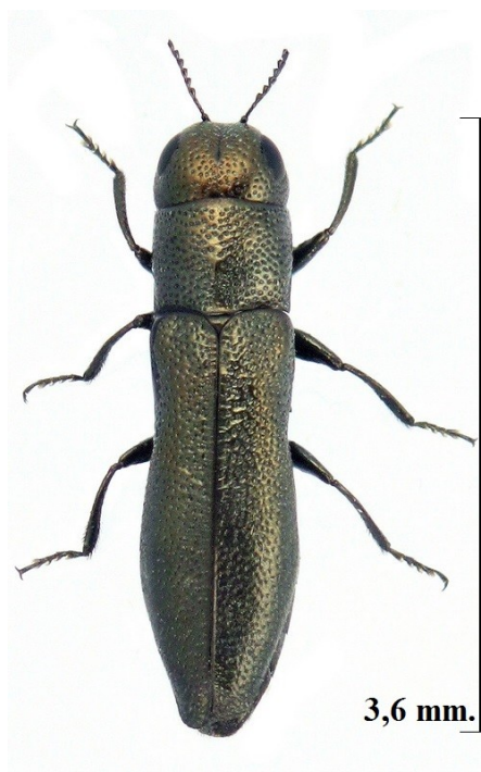
Fig. 1. Habitus de la especie.

El pasado 12 de abril de 2014 se extrajeron dos matas de gramíneas de un enclave perteneciente a la sierra de Segura en la provincia de Granada, término municipal de Huéscar, para reproducir en cautividad varias parejas de Iberodorcadion marmottani (Escalera, 1900) (Coleoptera Cerambycidae) que se habían capturado en el lugar. Para nuestra sorpresa, ya a finales de ese mes de abril, empezaron a emerger de dichas gramíneas, que habían sido sembradas en un insectario, algunos ejemplares del Aphanisticini Jacquelin du Val, 1863 objeto de ésta nota. En total se han obtenido nueve exs. en donde las características del último esternito abdominal permiten afirmar, como ya hiciera Cobos (1986), que la supuesta subespecie andalusiacus era tan sólo la muestra de la variabilidad individual de la especie. Unos ejemplares presentan el último esternito claramente bidentado mientras otros lo tienen simplemente escotado.