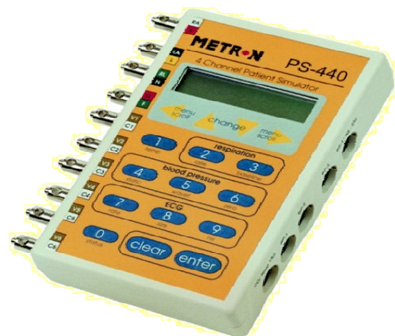
Figura 1 Equipo Patrón

Quizá la característica mas importante de PHP es su soporte para una gran diversidad de bases de datos, escribir un interfaz vía web para una base de datos es una tarea simple con PHP [6].