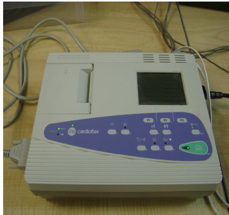
Figura 2. Equipo ECG a calibrar