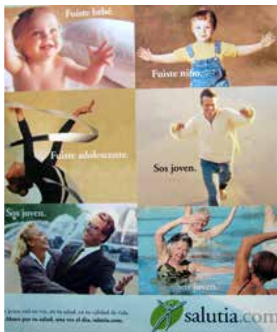
▲ Imagen 4: