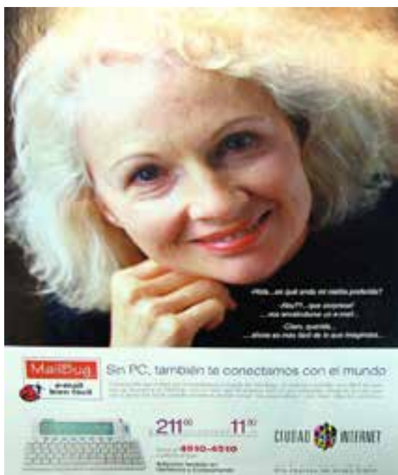
▲ Imagen 3: Fuente Revista La Nación, año 2000, imagen tomada el 9 de Junio de 2011, pág. 83.