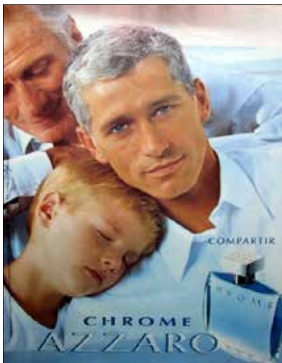
▲ Imagen 1: Fuente Revista Gente, año 2000, imagen tomada el 27 de Mayo de 2010, pág. 71.