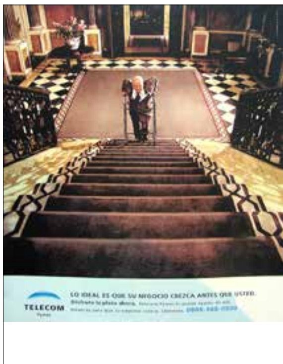
▲ Imagen 5: Fuente Revista Viva, año 2000, imagen tomada el 4 de Junio de 2011, pág. 15.