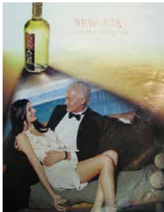
▲ Imagen 2: Fuente Revista Gente, año 2000, imagen tomada el 27 de Mayo de 2010, contratapa.