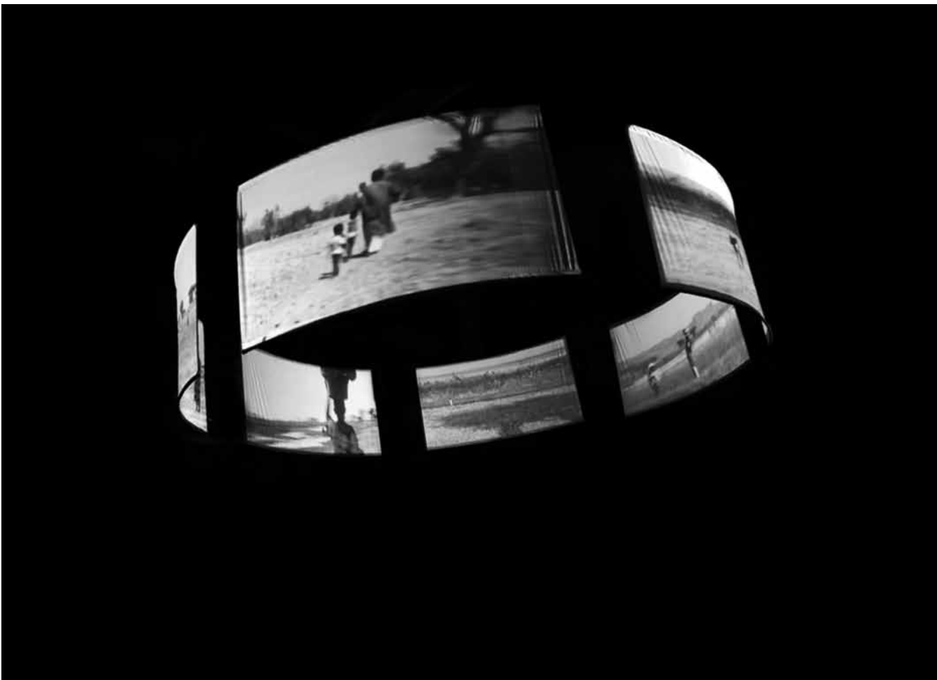
In-Quietud #3. Horitzons d'anada i tornada (2009-2010)

mateixa puc parlar d'un diàleg, d'aquesta transposició entre cultures, però que si jo tinc veïns que tots ells són de cultures diferents a la meua, em serà difícil convida-hi tot d'un plegat, i necessitaré temps d'adaptació, un temps que tots necessitem. Per tant, és molt fàcil parlar, però una de les coses que he après és que aquest desplaçament implica que l'experiència necessita un temps, un temps d'autoreflexió. És un temps necessari per a la interrelació, per a l'experiència, el desplaçament, l'acostament, un temps necessari per a tot diàleg. Això és el que implica aquesta subjectivitat nòmada, el que fa que es converteixi en una ètica.