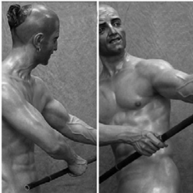
Figura 7. Sin duda, una de las obras maestras de la imaginería procesional del siglo XXI, además de altamente arquetípica del neobarroco gay, es el conjunto de figuras del misterio del Cristo Atado a la Columna de Martos (Jaén), obra de Francisco Romero Zafra en 2008. El triunfo de la anatomía musculada y poderosa “conquistada” en el gimnasio y ponderada por la mirada homoerótica constituye su mejor carta de presentación estética.

realistas” que parecen haberse impuesto en la imaginería procesional del siglo XXI, ambos autores pasan por ser los auténticos creadores del neobarroco gay por varios conductos. Esto es, ya sea mediante la androginia morbosa aplicada a algunas representaciones de personajes jóvenes (San Juan Evangelista o sayones, por ejemplo), como especialmente a una serie de figuras de personajes secundarios (soldados romanos, sayones...) ejecutadas para distintos misterios procesionales de Córdoba, Montilla, Martos, Zafra y de otros puntos de Andalucía. Además de una ejecución técnica impecable en modelado, talla y policromía, en todas ellas sobresale la espontaneidad en el tratamiento de las expresiones gestuales, sumada a la frescura hedonista a la hora de explorar la sensualidad del cuerpo masculino desnudo en todo su esplendor de fuerza y vigor muscular y haciendo gala de un inequívoco deleite voyeur . Y ello, por no hablar del sugerente decadentismo, de signo un tanto “canallesco”, aplicado a la descripción obsesiva y caracterización morbosa de los elementos personalizadores del cuerpo: tatuajes, piercings y tratamientos capilares. (Fig. 7)