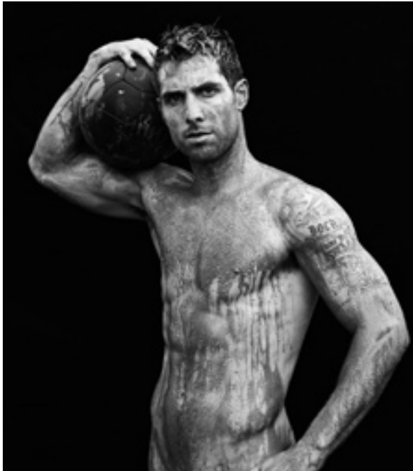
Figura 2. La consideración del deportista como ídolo de masas coexiste con la “puesta en valor” de su propio cuerpo, transformando el concepto clásico del ideal atlético en el más “comercial” de reclamo erótico o sex-symbol . Así se advierte de esta fotografía de Richard Phibbs del futbolista Carlos Bocanegra para la edición especial de ESPN, The Body Issue 2012 .

cialmente por los más jóvenes 13 . Sin embargo, a raíz de su conversión en ídolo de masas, el deportista asume un rol diferente en calidad de fetiche y reclamo al servicio de la propaganda institucional, el consumo y los intereses creados en torno al mismo 14 . Ello implica –y sin que tenga por qué ser necesariamente negativo– que su cuerpo se encuentre automáticamente “en venta”, al ponerse en valor en muchos casos no tanto su carisma personal o los méritos de su esfuerzo y trabajo, como lo más sensual de su anatomía 15 . (Fig. 2)