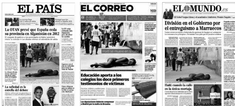
Figura 12: Portadas de diarios El País , El Correo y El Mundo (2010).

en el contexto informativo de la epidemia de cólera que castigaba la zona) si bien Haití, desde el terremoto, ya se había convertido en foco de interés informativo internacional y había movilizado a la opinión pública.