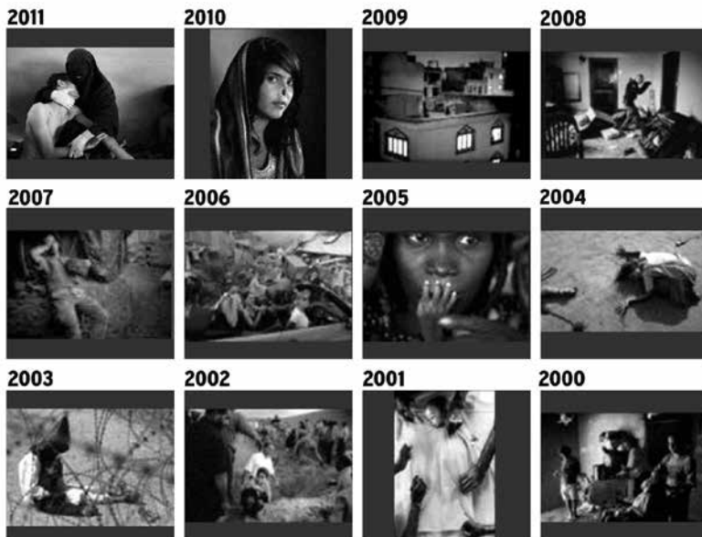
Figura 9: Fotos ganadoras del World Press Photo 2000-2011.

En la foto del 2007 se presenta a un soldado norteamericano en un búnker en el Valle de Korengal, Afganistán; en la del 2008 se trata de un investigador de la oficina del sheriff que entra a punta de pistola en una vivienda destrozada en Ohio (Cleveland, EE. UU.); en 2009, las mujeres protestan desde el tejado de una casa en Teherán en el contexto de las elecciones presidenciales en Irán. La foto del 2010 retrata a Bibi Aisha desfigurada por intentar huir de su marido en Afganistán; y la del 2011 a una mujer con velo junto a su hijo herido en una mezquita de Yemen.