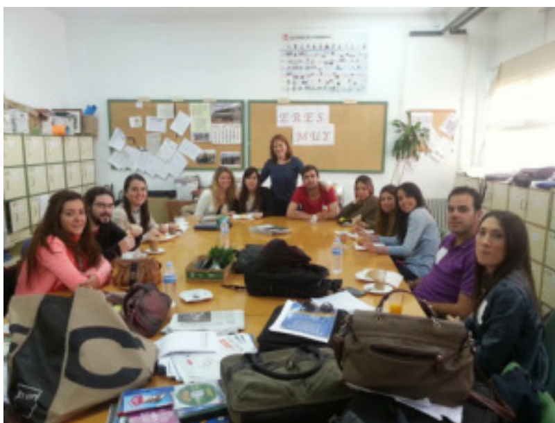
Taller de chicas “control de impulsos”

Son varias las actuaciones que se llevan a cabo en el centro cuya finalidad última es lo que hemos comentado. En esta presentación nos vamos a detener en el “taller de Control de Impulsos” y la “Orientación entre Iguales”. Estas dos experiencias son las que protagonizan este artículo.