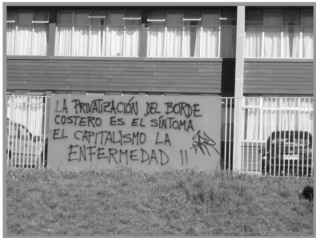
Imagen n.º 3: Rayado en la pared del Liceo Municipal Galvarino Riveros. Cuando se refieren a la privatización del borde costero es debido a que esta franja de maritorio está concesionada para actividades acuícolas (cultivo de especies, trabajo de extracción y maniobras de trabajo en general) y que a través de la figuras legales de concesiones acuícolas y marítimas han ido restringido el libre acceso de playa y mar, y por consiguiente condicionando ciertas actividades como la pesca.

Las nuevas actividades económicas, aumentaron el dinero circulante en un primer momento, lo que llevó al consumo de diferente productos importados, promocionados por medios de comunicación, entrando en una lógica de mercado, basada en el consumo de bienes de lujo, como parte del capital simbólico que se presumía como parte de la benevolencia del nuevo sistema productivo en la isla. 11