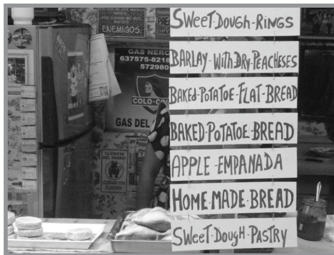
Imagen n.º 14: Promoción de productos gastronómicos típicos - tortilla de papa, empanadas de manzana, roscas chilotas -entre otros- a los turistas de habla inglesa en Feria Campesina de Yumbel.

Es una ciudad que en el discurso y la práctica se proyecta como proveedora de servicios turísticos y eso se puede apreciar en los instrumentos de planificación territorial (PLADECO) y materialmente en la proliferación de hospedajes de todo tipo y categoría (de acuerdo a los estándares internacionales de turismo) y la promoción de actividades veraniegas de todo tipo: venta de productos y servicios gastronómicos y artesanías propias y adquiridas de otras ciudades continentales.