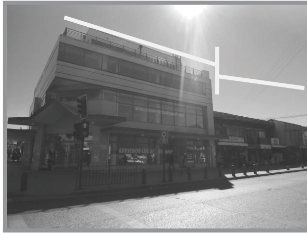
Imagen n.º 6: Calle San Martín. La calle principal del centro de Castro se encuentra dentro de área que concentra el comercio de la ciudad, siendo también el punto de convergencia de los habitantes isleños porque se localizan los terminales interurbanos de pasajeros. Como se observa en la fotografía, está en un proceso de renovación urbana con edificios de cemento y alturas mayores a la promedio de los edificios aledaños, localizado a una cuadra de donde se construye el mall de la ciudad.

Harvey, considera que “el mercado y la asignación de la renta urbana ya han reconfigurado muchos paisajes urbanos según nuevas pautas de conformidad”. 21 Estas pautas están determinadas por las nuevas actividades económicas (servicios especializados) y por inmobiliarias y empresarios que ven en la ciudad de Castro una fuente de ingresos con la creación de diversos servicios, ya sea para el consumo directo de una población flotante o empresas y una población residente que aumenta, y por tal motivo necesita de una vivienda, equipamiento y servicios.