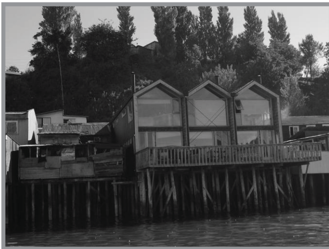
Imagen n.º 9: Palafitos de calle Pedro Montt. Estas viviendas han adquirido importancia para la industria del turismo y algunas han sido restauradas, otras construidas totalmente y habilitadas como hostel o cabañas, la diferencia en altura, distribución de espacios y materiales entre estas es evidente debido al cambio de funcionalidad. Este proceso comenzó en los palafitos del sector de Gamboa.

Este proceso de hibridación del paisaje tiene el carácter de urbanal debido a que la dinámica que los crea esta en directa relación con la generación o permanencia de lugares vinculada a una urbanización supeditada a intereses económicos y avalado por el Estado