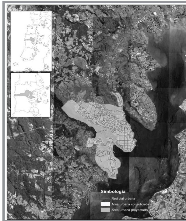
Imagen n.º 12: En el plan regulador comunal se identifican las siguientes unidades geomorfológicas como áreas de extensión urbana: Llau-Llao, la Montaña, la Chacra, Castro, Gamboa - Las Canteras, el Aeródromo y Nercón (bajo y alto).

Con referencia específicamente a la morfología y funcionalidad urbana podemos puntualizar que las primeras aproximaciones nos indican que la ciudad se encuentra en un proceso de transformación debido a nuevas relaciones de dependencia, a un crecimiento de su periferia y una renovación urbana influenciada por patrones arquitectónicos externos.