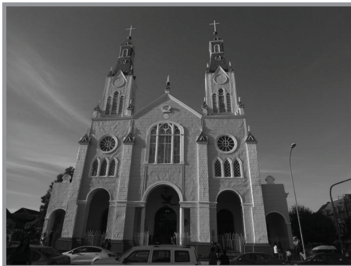
Imagen n.º 2: Iglesia de Castro, Patrimonio de la Humanidad. Las iglesias de Chiloé son un icono de la arquitectura insular, que han sido considera únicas por su estilo de construcción y materiales.

El caso más significativo es la relevancia que han adquirido las casas palafíticas, que en los años 80 quisieron ser erradicadas, desapareciendo el barrio Pedro Aguirre Cerda, pero que en la actualidad son un bien preciado para la actividad turística y se consolidan como áreas de servicios turísticos.