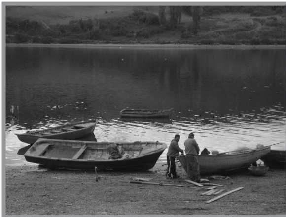
Imagen n.º 11: Caleta de pescadores artesanales. La actividad pesquera artesanal ha permanecido adaptando sus prácticas a pesar de la disminución de los recursos. Hoy, en la ciudad existe una caleta ubicada en calle Pedro Montt, localizada dentro del área de los palafitos.

Hoy podemos rescatar ciertas actividades tradicionales que todavía se realizan en dentro de ciudad de Castro y pasan a ser parte del paisaje tradicional como es la construcción de embarcaciones y la pesca artesanal, entre estas extracción de orilla y pesca con red, actividades características de la Isla de Chiloé -principalmente en las áreas rurales-. Ambas han reducido su importancia dentro de la nueva realidad urbana pero no ha desaparecido. Los maestros de ribera siguen construyendo embarcaciones pero ahora ayudados de cierta tecnología y herramientas que hacen de esta actividad una tarea más sencilla y en menor tiempo. En cuanto a la pesca artesanal, todavía en horas de bajas mareas se encuentran personas en el río Gamboa, sector de Ten Ten o Nercon, en busca de mariscos. Lo mismo sucede con la pesca con red, aun cuando muchos de los pescadores se dedicaron a otras actividades consecuencia del empobrecimiento de los mares, estas prácticas -parte de la cultura bordemar- resisten a su desaparición.