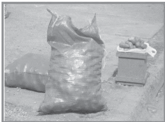
Imagen n.º 15: Venta de papas en almid, en la rampa de embarco.

Podemos considerar que hay sectores donde todavía sigue presente la cultura que le dio vida y reconocimiento a Chiloé; donde existen prácticas de la cultura chilota, como es el sector de la desembocadura del río Gamboa; donde se encuentran casas palafito habitados por sus primeros propietarios, también está localizado un astillero de ribera y en horas de marea baja se encuentran personas mariscando.