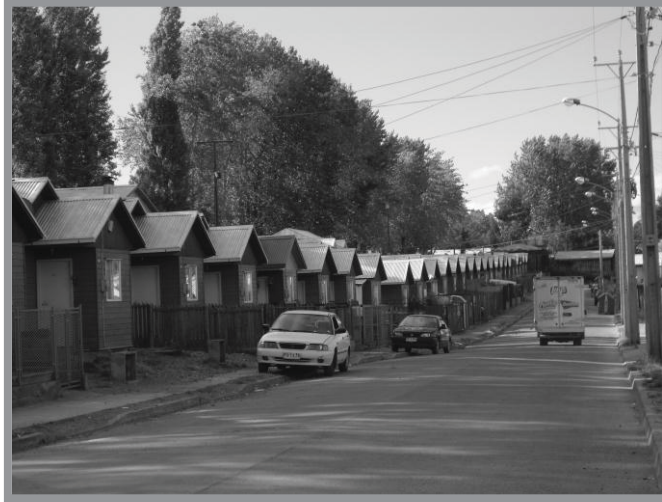
Imagen n.º 8: Nuevo conjunto habitacional en la periferia de la ciudad en Av. Galvarino Riveros. Estas nuevas urbanizaciones son el resultado de políticas habitacionales a nivel nacional, son casas pareadas donde la cocina, antiguamente el espacio más amplio y donde ocurría la vida familiar se ha reducido en m 2 , reemplazado hoy por el living como el espacio más utilizado dentro del hogar. Este tipo de vivienda la encontramos en diferentes regiones del país, el mismo diseño y características constructivas.

Para Pierre Donadieu el paisaje es identidad, resultado de la relación entre un territorio geográfico y un grupo social que lo reivindica. Para el autor existen dos polos en la producción de identidades espaciales: uno que revela un déficit de identidad: amnesia, abandono, peligro, relegación o un "no lugar", y uno que revela un exceso de identidad: folclorismo, acaparamiento o normalización. 30