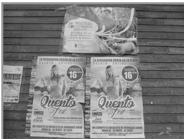
Imagen n.º 4: Publicidad de eventos veraniegos en la comuna. Aquí se promocionan dos eventos: en la parte superior el Festival Costumbrista de Castro y en la parte inferior una fiesta en la Playa de Quento con música electrónica.

A este proceso de expansión urbana derivada del aumento de habitantes en búsqueda de oportunidades laborales en la industria y comercio, se agrega la importancia que ha adquirido el turismo que necesita de parte de la ciudad y manos de obra para su funcionamiento.