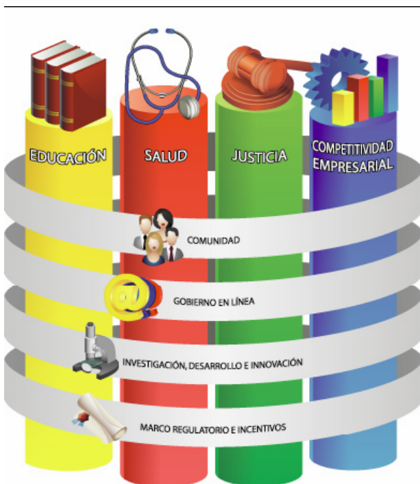
Figura 1. Matriz de ejes de acción del plan Nacional de TIC

En esta dinámica que han generado las nuevas tecnologías, aquellos individuos y organizaciones que logran apropiarse de ellas, aprovechándolas para su propio beneficio, tienen muchas ventajas frente a quienes no lo hacen. Se configura entonces la denominada brecha digital, que se refleja en un desequilibrio de acceso al conocimiento entre diferentes países o grupos y organizaciones sociales. El Plan Nacional de TIC se estructurará alrededor una matriz de ocho grandes ejes o líneas de acción, cuatro verticales y cuatro transversales: educación, salud, justicia y competitividad empresarial. Figura 1.