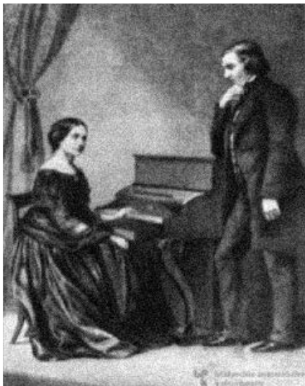
Clara Wieck Schumann