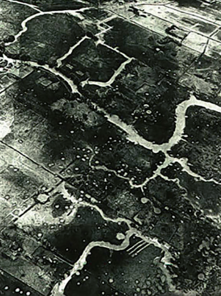
Vista aérea de la zona