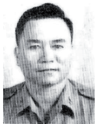
General Huỳnh Văn Cao

de pequeñas acciones a lo largo de todo el país. Aún así, Vietnam del Norte seguía temiendo la intervención norteamericana y rehusó proporcionar cualquier tipo de ayuda militar, lo que obligó a las tropas del Viet Minh a retirarse a zonas de difícil acceso como las montañas y los estuarios de los ríos. Se abrió así una fase de equilibrio donde las tropas gubernamentales no podían acceder a esas áreas tan recónditas donde los guerrilleros se podían replegar sin grandes dificultades.