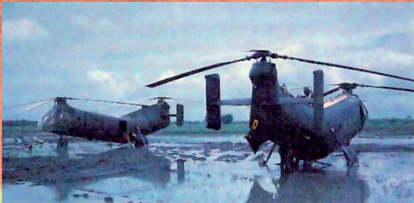
Helicópteros de transporte

Los grupos al sur de la aldea de Bac parecían estar a punto de romperse, recibiendo fuego constante desde el aire y de artillería, no obstante bastante ineficaz. Una pequeña fuerza un poco expuesta y cerca de la línea de árboles del sur se replegó, pero en vez de dirigirse a Bac, terminó yendo a Tan Thoi y se negó a volver al sur. Pero el retraso sufrido en el avance de los M-113 permitió el remunicionamiento de las unidades y que los jefes insuflasen nuevo valor y orden a sus tropas. Para cuando se retomaba el combate el orden y la moral había vuelto a las líneas del Viet Cong.