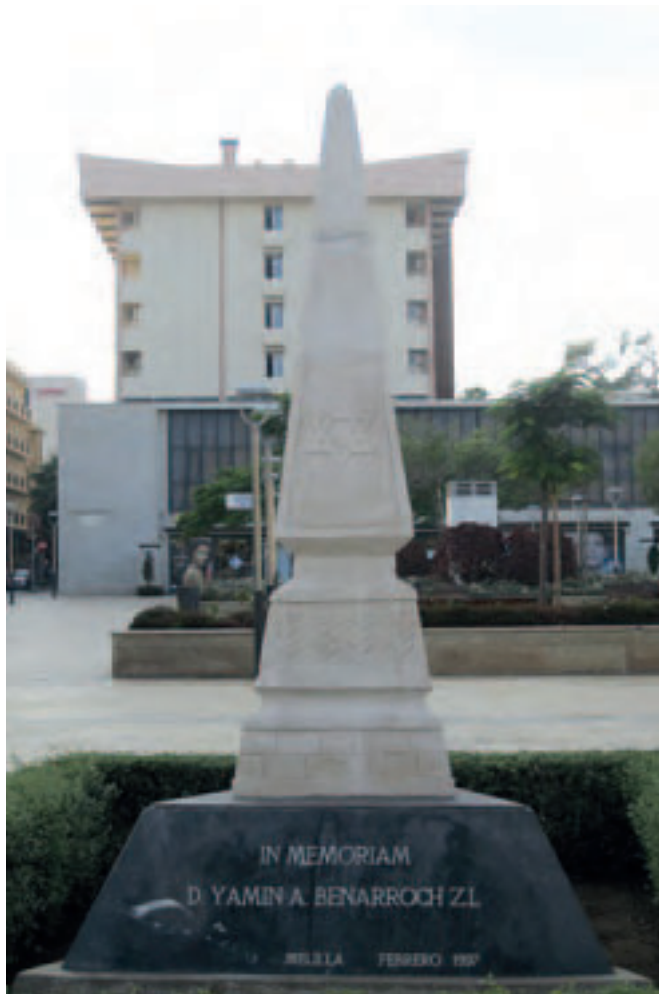
(Figura 12) Monolito homenaje al Sr. Benarroch (SGA).