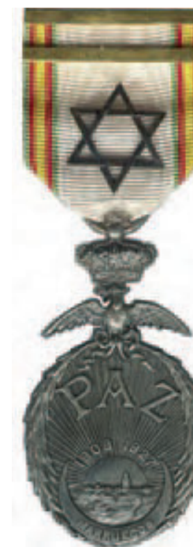
(Figura 7) Medalla de la Paz de Marruecos (1927).

Este filántropo que gratificará, en Tánger, a los niños que fueran a la lectura de los salmos (“Meldar Tehilim”) 53 , colaborará, asiduamente, con otras entidades benéficas, como es el caso, entre otros, del “Ropero de Santa Victoria”