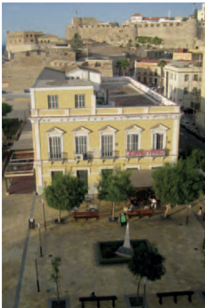
(Figura 11) Plaza de Yamín A Benarroch.