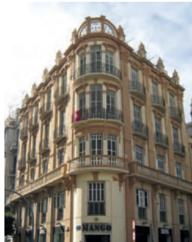
(Figura 10) Edificio de “El Acueducto” –Arq. E. Nieto– (SGA).

Es en este tramo del inmueble donde aparecen las tres bandas secesionistas: en el tercio superior de los pilastrones, en el cuerpo de los pináculos finales y en el herraje que los une –compartiendo su protagonismo con los círculos–. Todo el alzado es un trino en su tectónica y en la mayoría de su ornamento, y, asimismo, un placer en la contemplación de la confección de su delineado. Su estética responde a un modernismo que funde diseños del: Liberty italiano, en las arcuaciones del último piso, del Secesionismo vienés, por su síntesis geométrica y del Art Nouveau francés, en lo volumétrico de su exorno. Sin olvidar la influencia oriental de esas cúpulas bulbosas, coronadas en su segundo cuerpo y rematadas por veletas de desarrollo en espiral y cuyo precedente, en Barcelona, lo podemos encontrar en “Casas Castillo Villanueva”, obra del arquitecto Julio Fossas y Martínez (1904-1909) e históricamente en las iglesias ortodoxas y sinagogas de Europa Central y del Este, entre otras.