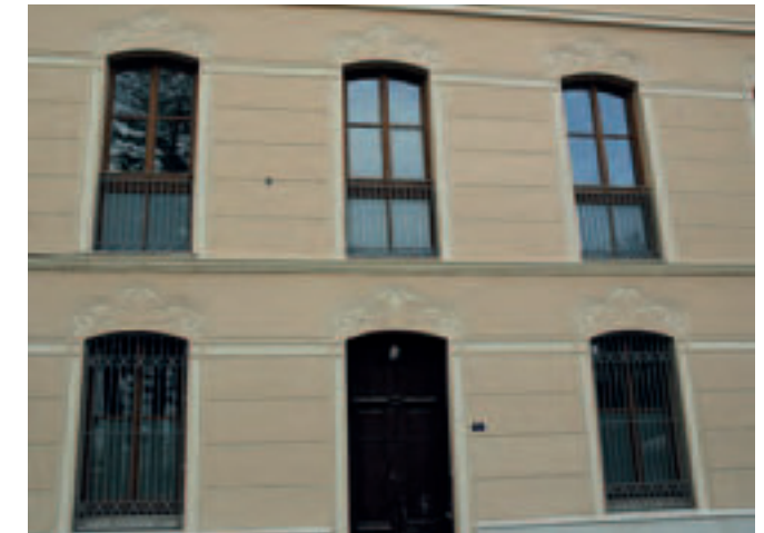
(Figura 5) Comunidad Israelita en c/ Duquesa de la Victoria (SGA).