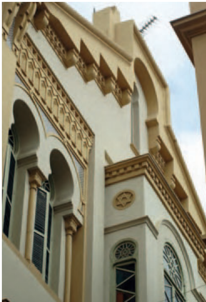
(Figura 8) Sinagoga de Yamín Benarroch "Or Zaruah" –detalle– (SGA).

Marruecos 63 . Esta distinción, será creada por Real Decreto de Presidencia (1947/ 21 noviembre 1927) 64 , para conmemorar la feliz terminación de la acción militar encomendada a España en la zona Norte de nuestro Protectorado 65 . Según el artículo 3º, en su apartado H, podrán optar a la misma, los musulmanes e israelitas que sin haber pertenecido al Ejército de África ni desempeñado servicios en la Administración del Protectorado, los hayan prestado de carácter político, contribuyendo con ellos al buen éxito de nuestra acción en Marruecos o, el apartado I, la población civil [...] de Melilla en junio y julio de 1909 y desde julio a diciembre de 1921 66 o los paisanos que con cualquier fin hayan seguido al Ejército de operaciones en diversos campamentos y posiciones, o prestado servicios de asistencia a las tropas 67 . (figura 7)